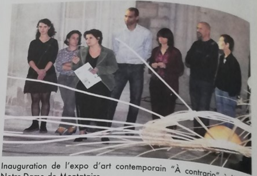
Inauguration de l'expo d'art contemporain "À contrario" à l'église Notre-Dame de Montataire