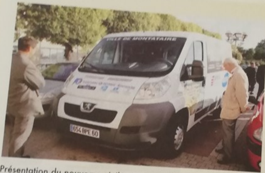
Présentation du nouveau minibus à disposition des associations et des services municipaux