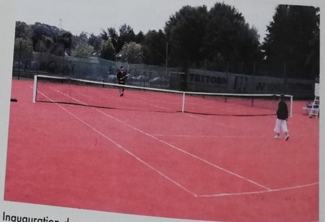
Inauguration des cours de tennis rénovés