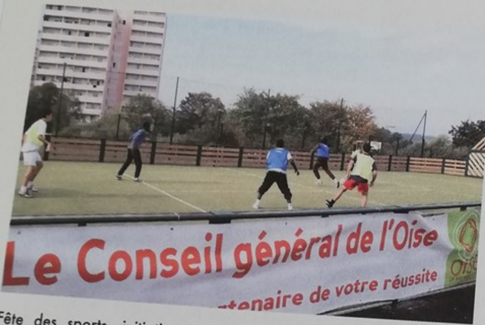
Fête des sports, initiation à la pratique de différentes disciplines sportives organisée par le Conseil général et les clubs sportifs de Montataire