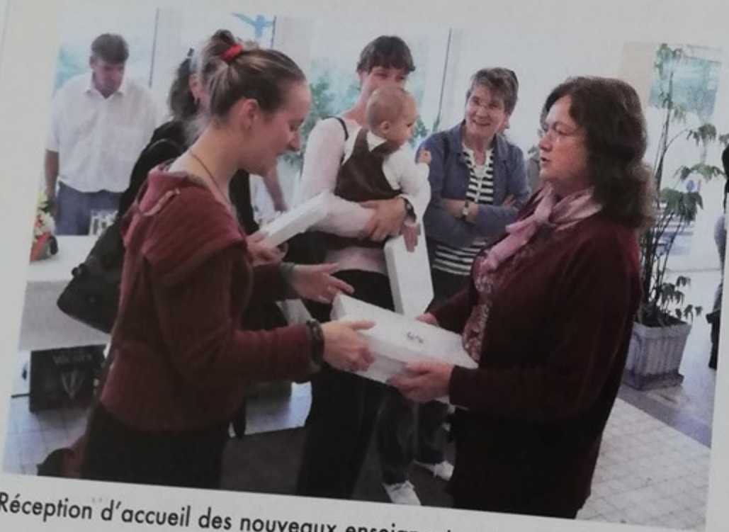
Réception d'accueil des nouveaux enseignants exerçant à Montataire