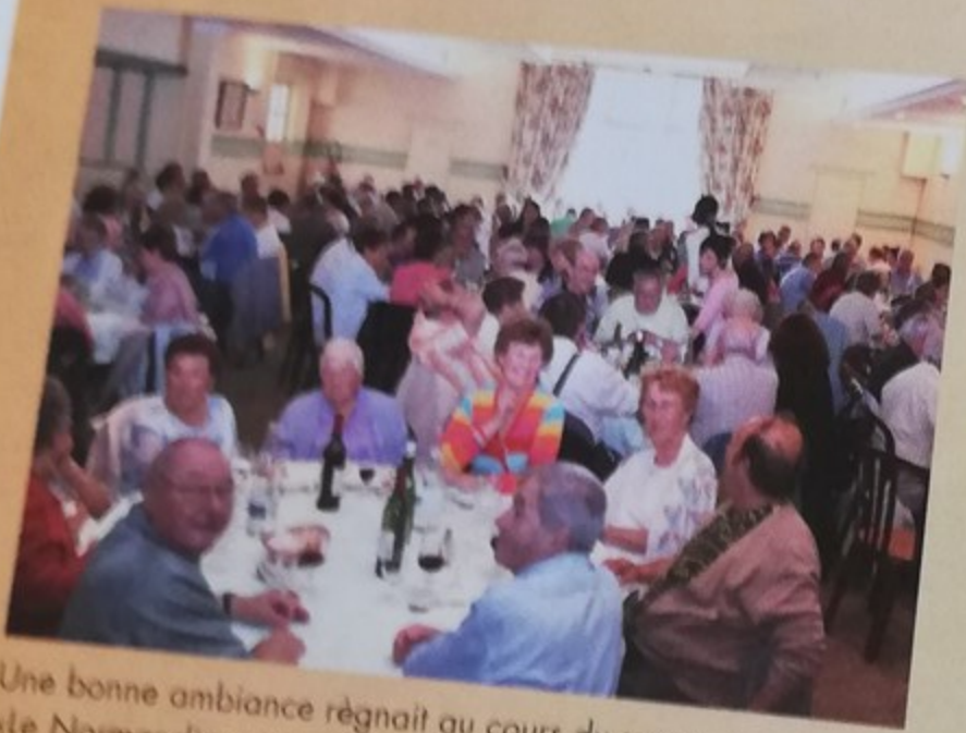
Une bonne ambiance régnait au cours du repas au restaurant «Le Normandie» situé dans le centre ville de Fécamp