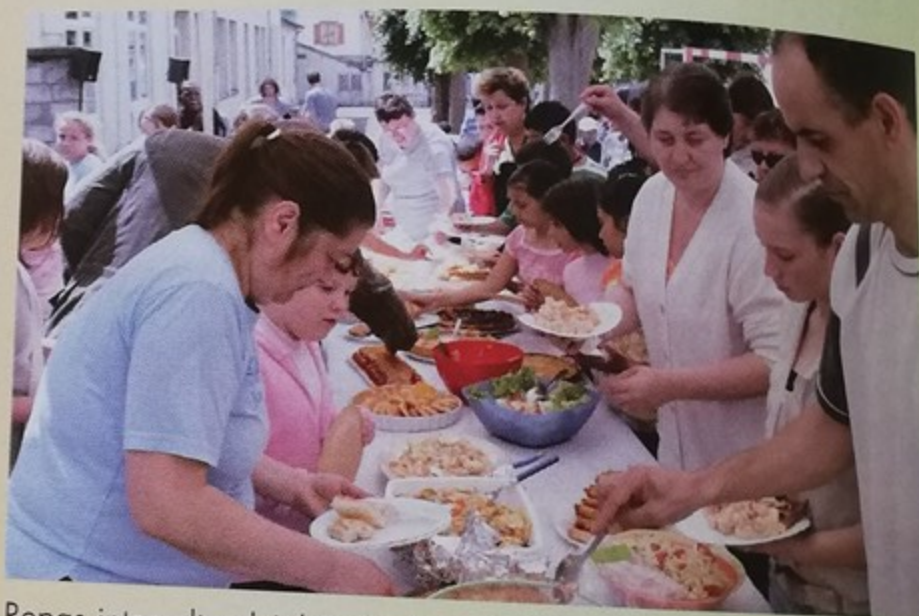
Repas interculturel à l'école Jean Jaurès