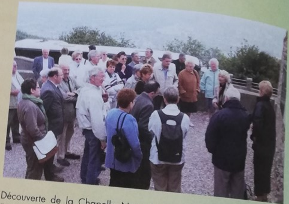
Découverte de la Chapelle Notre Dame de Salut sur les hauteurs de Fécamp. Vue panoramique sur le port