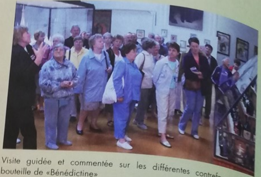
Visite guidée et commentée sur les différentes contrefaçons de la bouteille de «Bénédictine»

Comme chaque année la municipalité a offert à tous les retraités un voyage qui leur a permis de visiter Fécamp