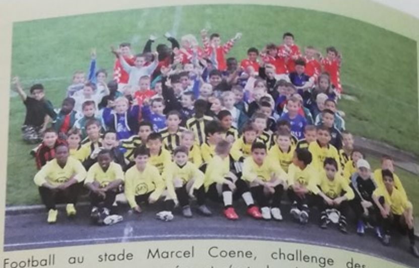
Football au stade Marcel Coene, challenge des poussins, 13 équipes étaient engagées et c'est plus de 130 enfants qui ont participé à cette compétition