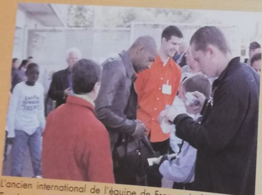
L'ancien international de l'équipe de France de football, José Touré, très entouré par les jeunes de Montataire à l'occasion d'une rencontre de foot organisée par l'association «Un projet pour tous» contre le Variété club de France