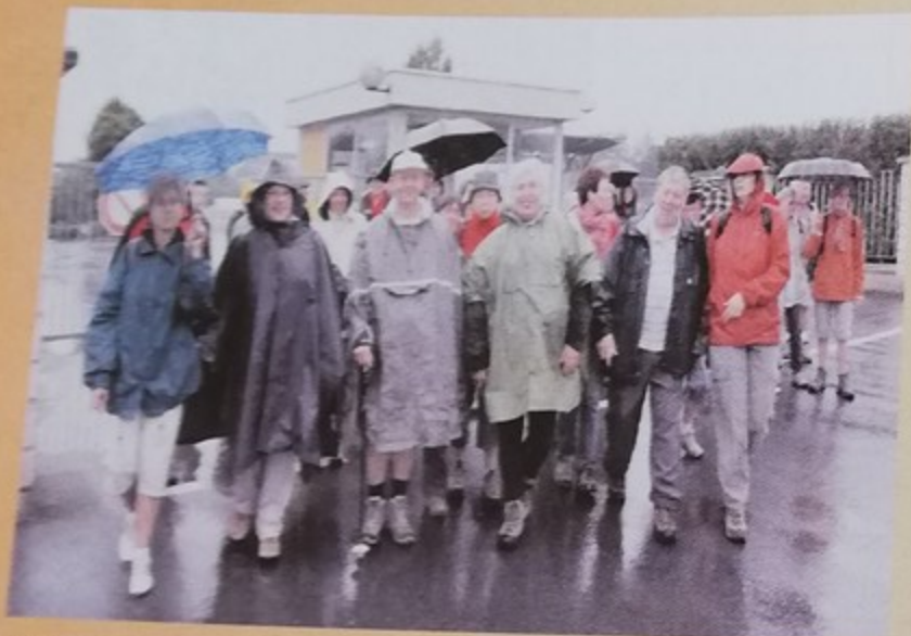
Malgré le mauvais temps, beaucoup de participants pour le parcours du cœur organisé par la Fédération française de cardiologie