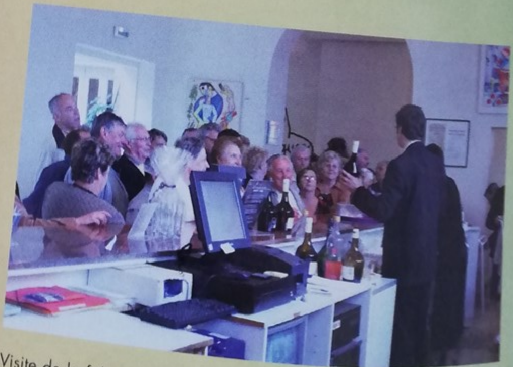
Visite de la fabrication de la Bénédicte, suivie d'une dégustation