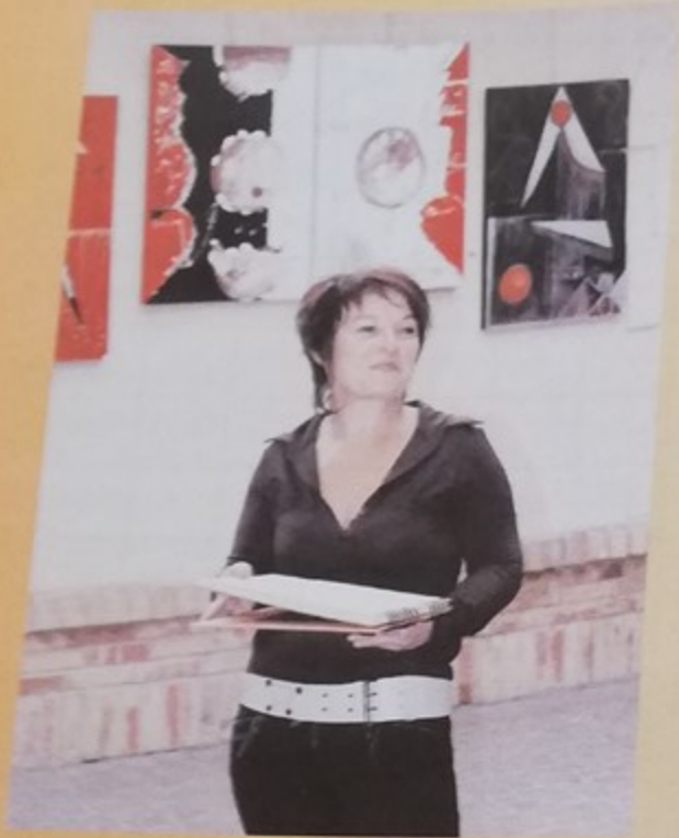
Exposition de peintures au Palace de Mme Catherine Vanlerberghe