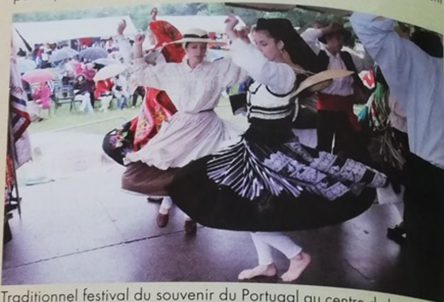
Traditionnel festival du souvenir du Portugal au centre de loisirs Pierre Legrand