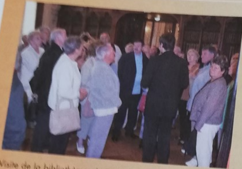
Visite de la bibliothèque du Palais de la Bénédicte