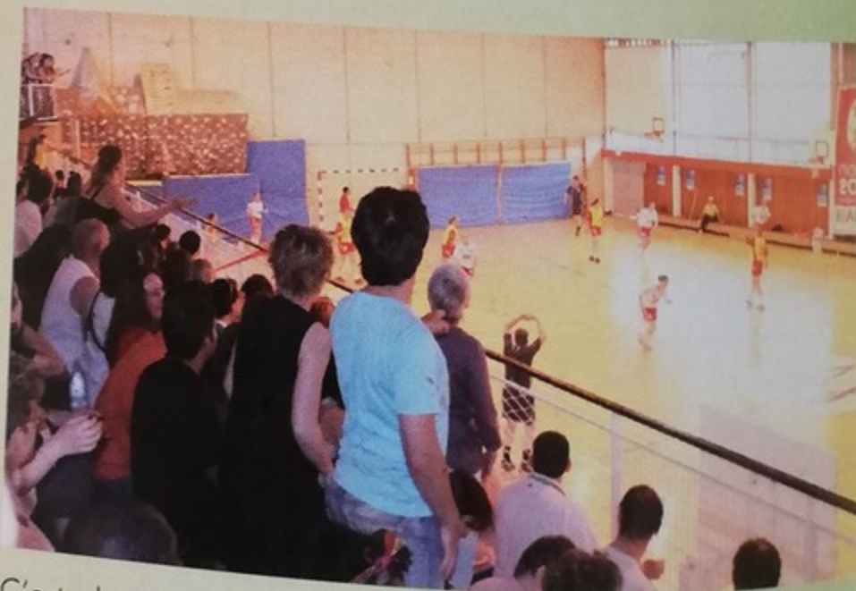
C'est plus de 5000 personnes qui ont assisté au Championnat de l'Oise de Hand-ball à la salle Marcel Coene le samedi 2 et dimanche 3 juin 2007