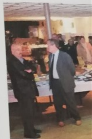
Inauguration de la fête thème «Front populaire à Montataire»