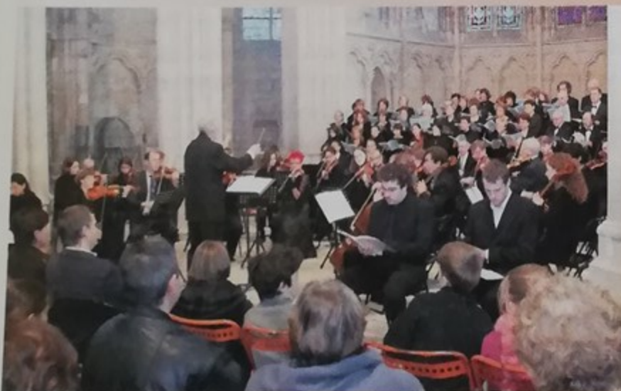
Concert à l'église Notre-Dame : requiem de Mozart par l'orchestre Colligno et le chœur du Ménestrel de Chantilly