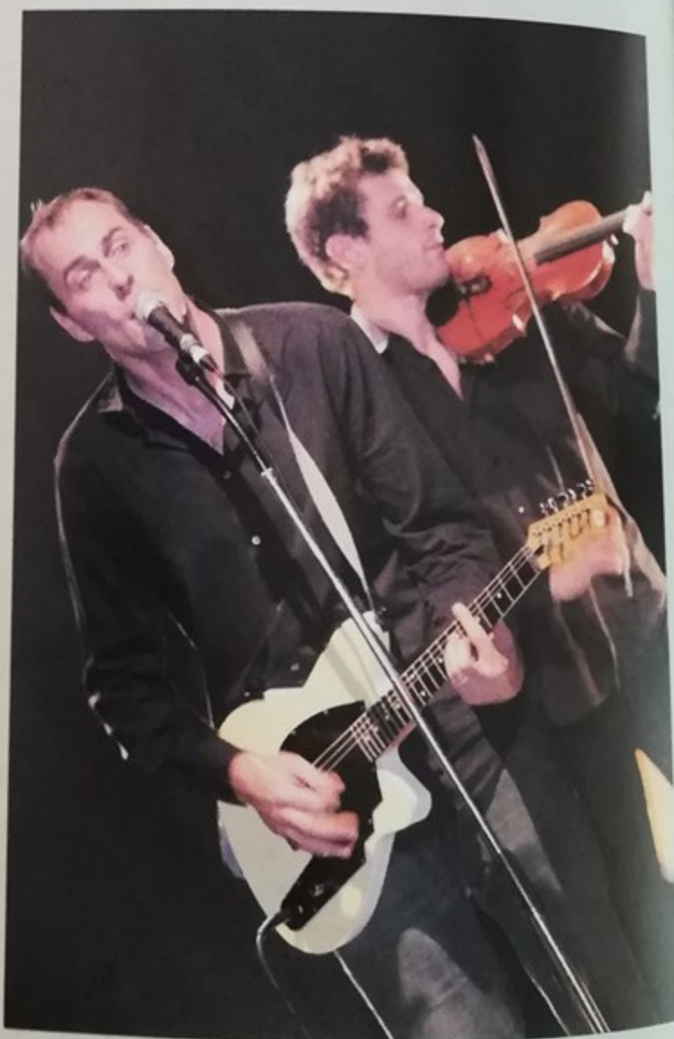
Le groupe El Gafra au Palace, musique métisse, textes en arabe, kabyle ou français, un mélange audacieux