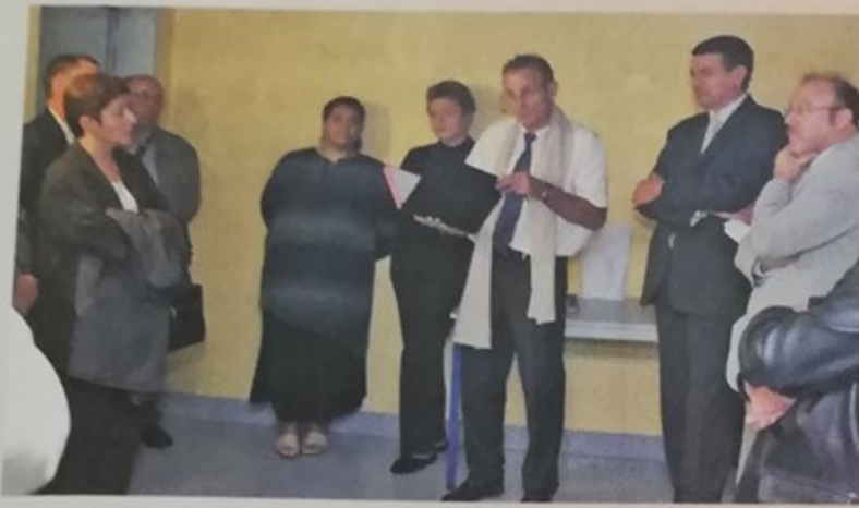
Charte d'escalier au 1, rue Jacques Decour. Instaurée par Oise-habitat, la charte témoigne d'un engagement mutuel entre l'organisme et les locataires pour améliorer le cadre de vie