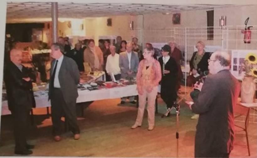
Inauguration de la fête du livre et de la semaine bleue sur le thème «Front populaire, 1936-2006 jeunes et vieux... ensemble à Montataire»