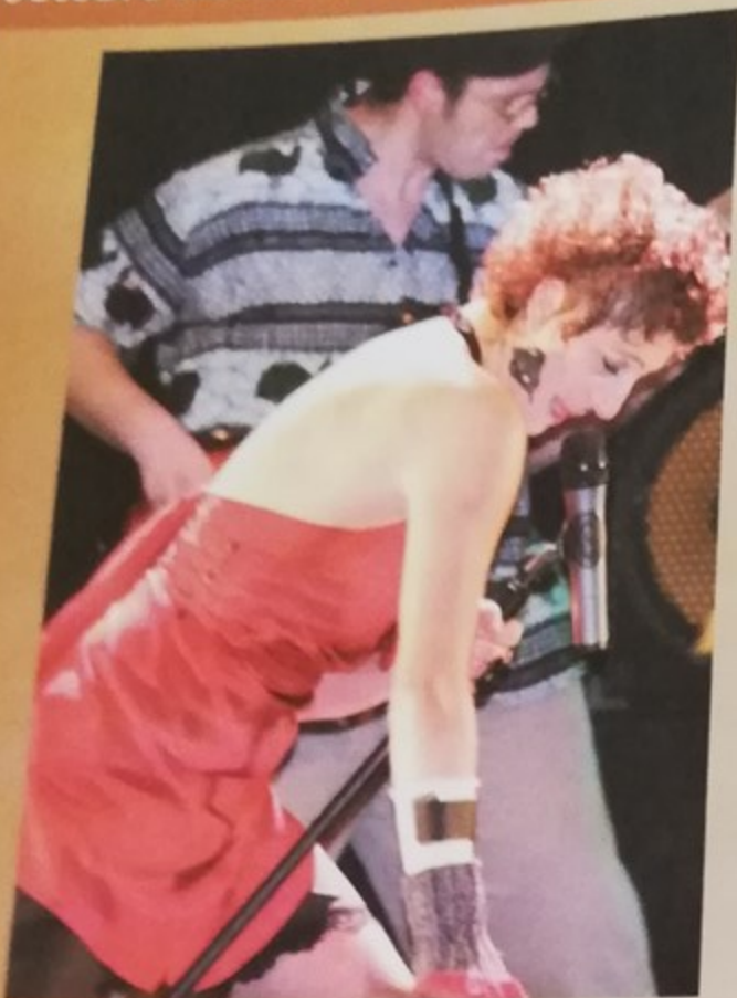
Le groupe «Mange moi» au Palace, chansons érotico-festives entre rock, funk et valse