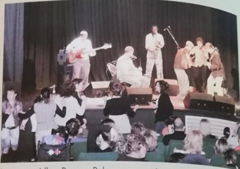
Le groupe Ilders Row au Palace, une musique très personnelle, et un amour certain de la scène !