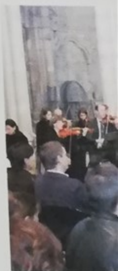
Concert à l'église l'orchestre Col'l