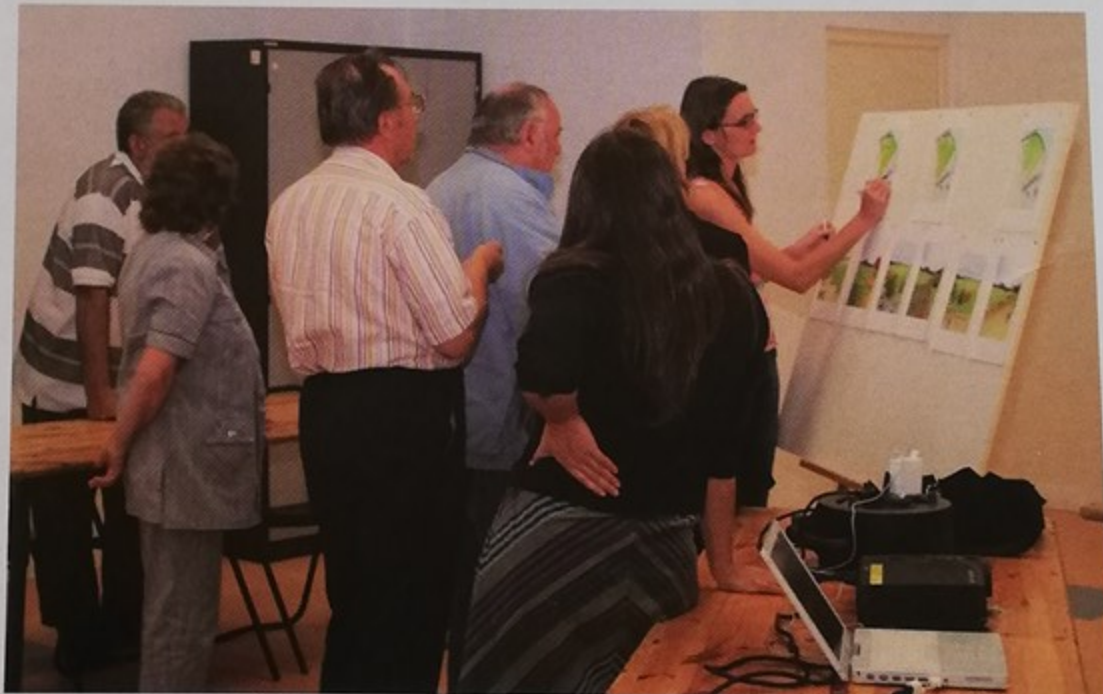
La paysagiste présente les esquisses des différents projets pour le futur espace public de Grêle

Le même nombre de places de stationnement