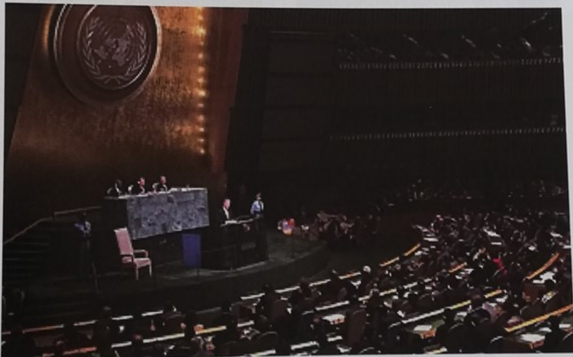
Assemblée générale des Nations Unies

obligatoires des Etats membres, celles-ci sont aujourd'hui insuffisantes, et ce quand les Etats «pensent» à les verser. L'ONU est par conséquent dépendante des moyens humains, matériels et financiers que les Etats veulent bien lui accorder. On se souviendra par exemple de la cacophonie qui a présidé à l'envoi d'une force intérimaire au Sud Liban ou de l'impossibilité, encore aujourd'hui, de constituer une force de maintien de la paix au Darfour. Le besoin de réforme est évident et attendu par la communauté internationale à l'exception des membres