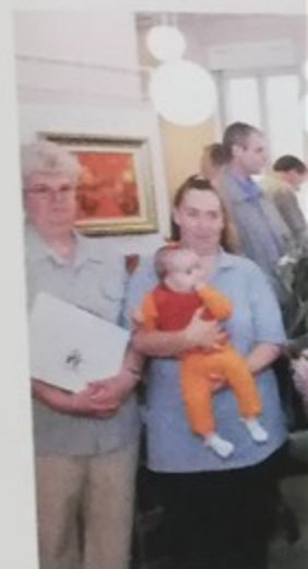
Remise de prix de la clôture des S