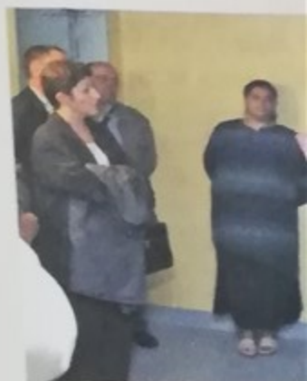
Charte d'escalier au 1, rue habitat, la charte témoigne nisme et les locataires pou