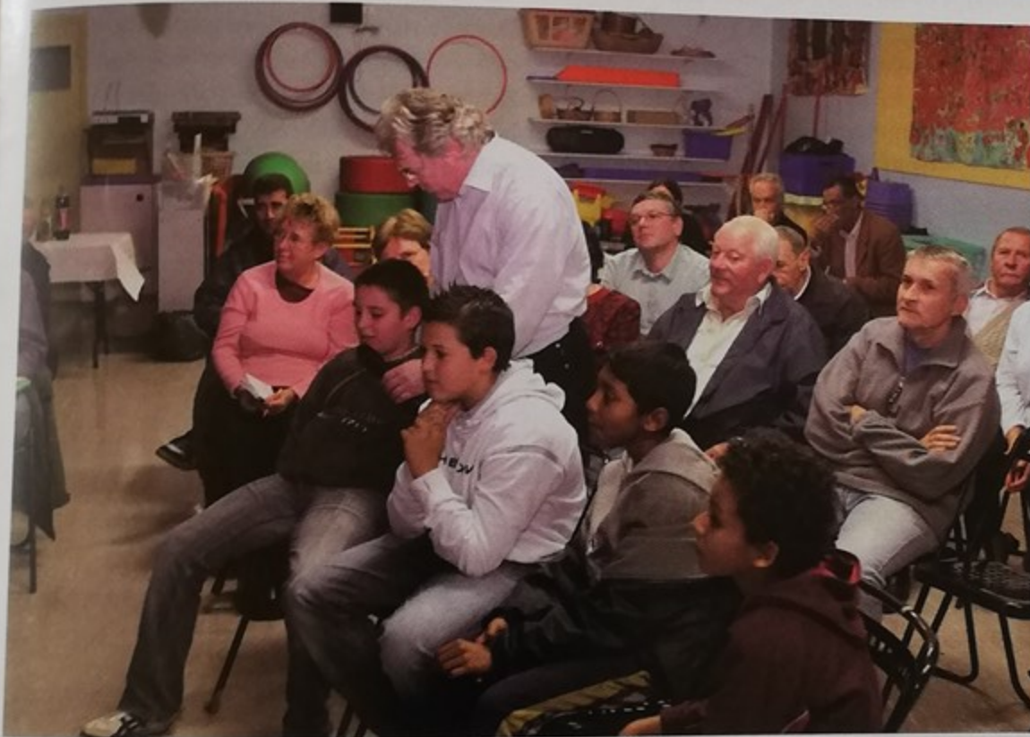
Les enfants aussi s'expriment dans les réunions de quartiers comme ici à l'école Langevin

trentaine d'entre eux l'an passé, un forum pour l'emploi a été organisé en avril. Parmi les 750 visiteurs, une vingtaine de jeunes ont ainsi trouvé un travail le jour même et de nombreux contacts avec les employeurs présents ont pu être noués.