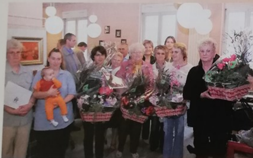
Remise de prix du concours de fleurissement 2006 à l'occasion de la clôture des Semaines régionales de l'environnement