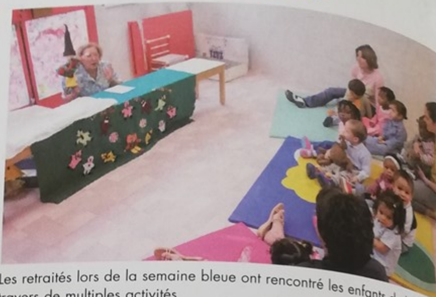
Les retraités lors de la semaine bleue ont rencontré les enfants de la ville à travers de multiples activités