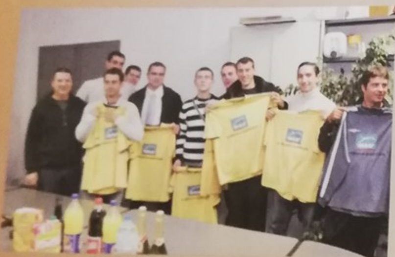
Le Hand-ball Club de Montataire a reçu ses nouveaux maillots