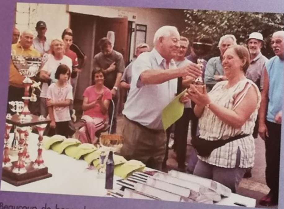
Beaucoup de bonne humeur au concours de boules organisé par la Fédération Nationale des Anciens Combattants d'Algérie