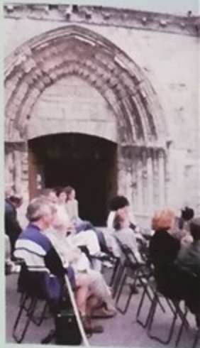
Eglise Notre-Dame : s européennes du patrim