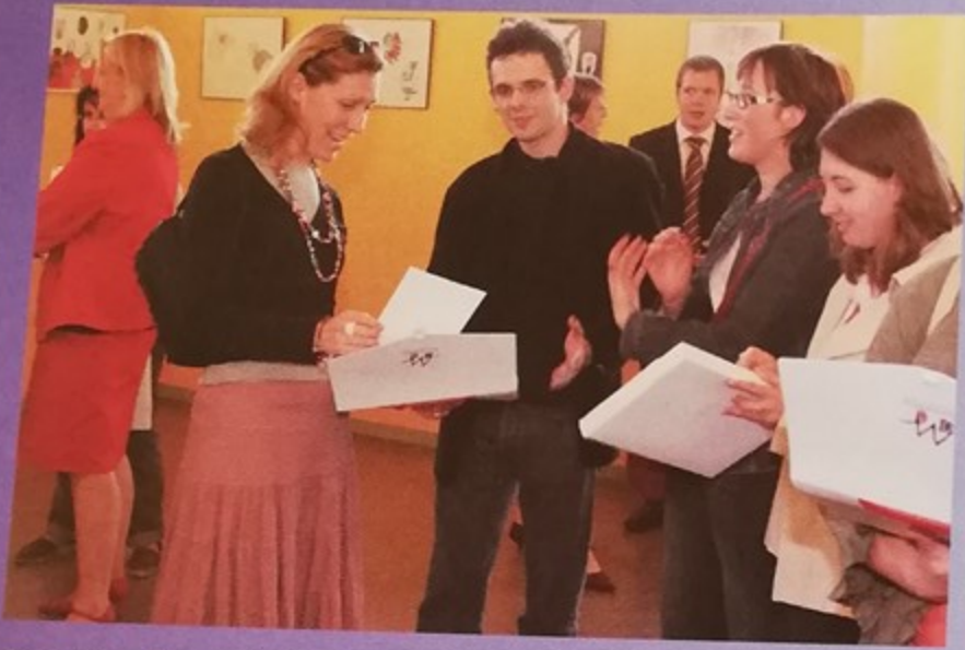
Réception d'accueil des nouveaux enseignants de Montataire au lycée André Malraux. Tous nos encouragements aux enseignants dans l'accomplissement de leur mission