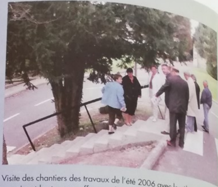
Visite des chantiers des travaux de l'été 2006 avec les élus, ici les élus examinent les travaux effectués dans la côte des Marronniers