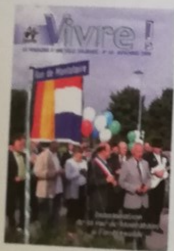
Notre couverture :

Le maire accompagne les nouveaux habitants qui ont visité la ville et notamment les nouvelles installations du multi-accueil