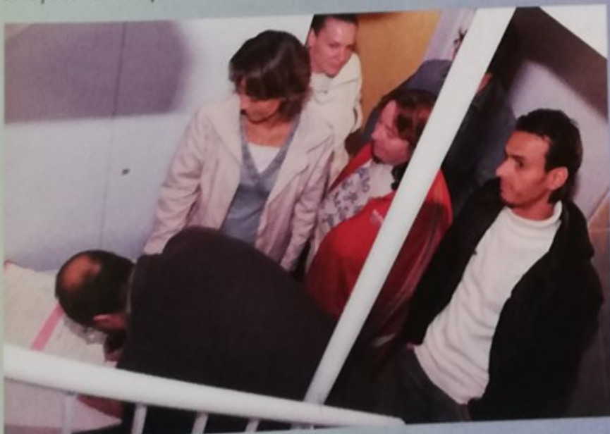
Charte d'escalier au 21, rue Gabriel Péri, instaurée en 1996 par Oise-habitat, la charte témoigne d'un engagement mutuel entre l'organisme et les locataires pour améliorer le cadre de vie