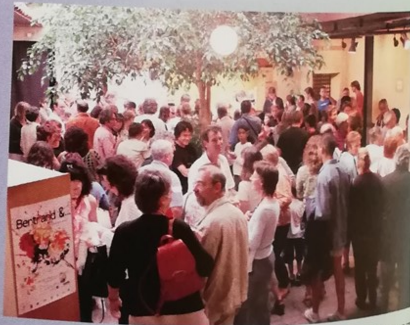
Beaucoup de monde à l'ouverture de la saison culturelle 2006-2007 au Palace