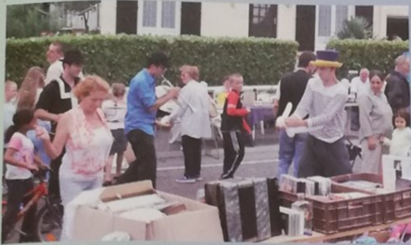
10ème anniversaire de la brocante du quartier des Fonds de Montataire