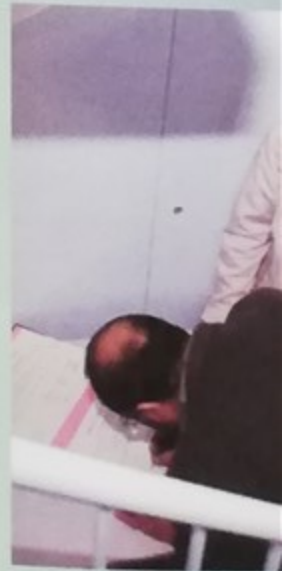
Charte d'escalier au 2 Oise-habitat, la chart l'organisme et les loca