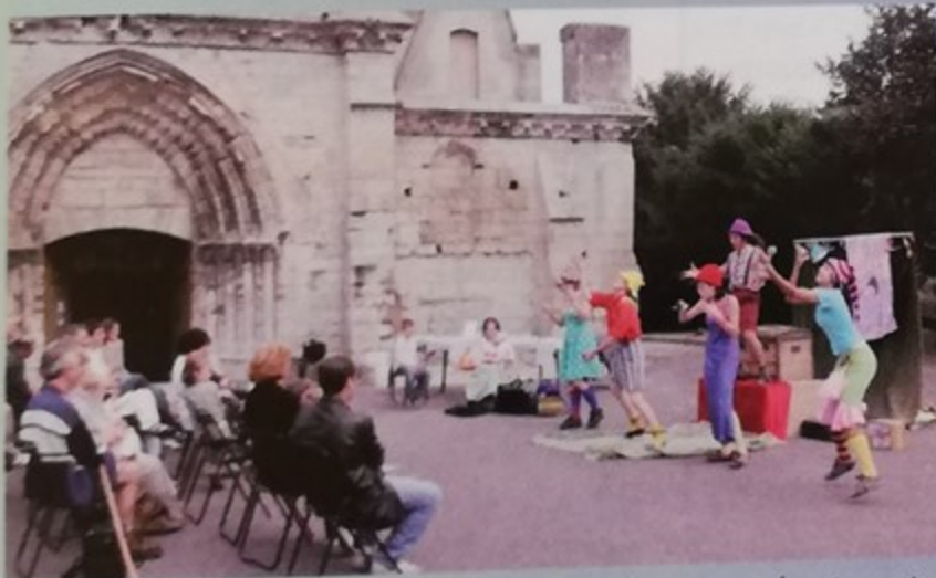
Eglise Notre-Dame : spectacle des "Bestiolz" pour les journées européennes du patrimoine