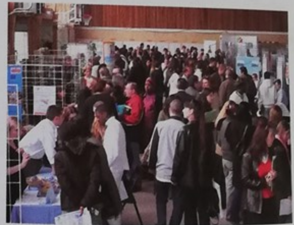
Au printemps, 700 jeunes ont participé à Montataire au forum des métiers pour l'emploi

Dans ce contexte, les élus de Montataire entendent poursuivre le rassemblement de leurs concitoyens. Pour répondre à la préoccupation des jeunes en recherche d'emploi, ils ont organisé en avril dernier avec différents partenaires, un Forum des métiers pour l'emploi qui a connu un véritable engouement au coeur même du quartier des Martinets. Plus de 700 jeunes y ont participé. Ils ont eu l'occasion de rencontrer directement des chefs d'entreprises. Le jour même 20 jeunes ont été recrutés et 30 % des participants ont pu obtenir un rendez vous avec le responsable du recrutement de l'entreprise. Quant aux représentants des entreprises, ils ont affiché une grande satisfaction, tous ayant estimé qu'ils ont trouvé des profils intéressants et une très bonne qualité des échanges. Comme quoi il faut se garder des stéréotypes sur la jeunesse, trop souvent véhiculés par les grands médias. Une initiative bienvenue qui devrait avoir des suites ces prochaines semaines avec une nouvelle mobilisation des élus, des partenaires et des jeunes.