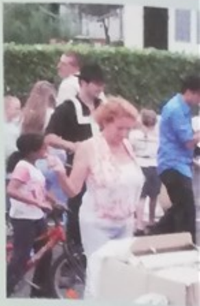
10ème anniversaire de Montataire