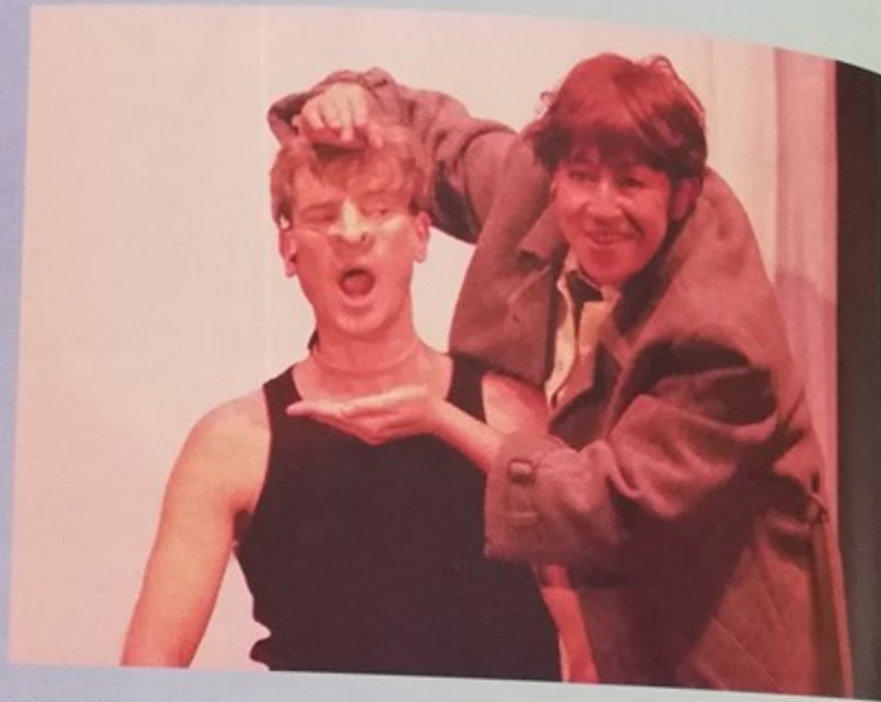
Comédie musicale "Battements de cœur pour duo de cordes" au Palace, mise en scène de Jean-Luc Annaïse à l'occasion de la présentation de la saison culturelle