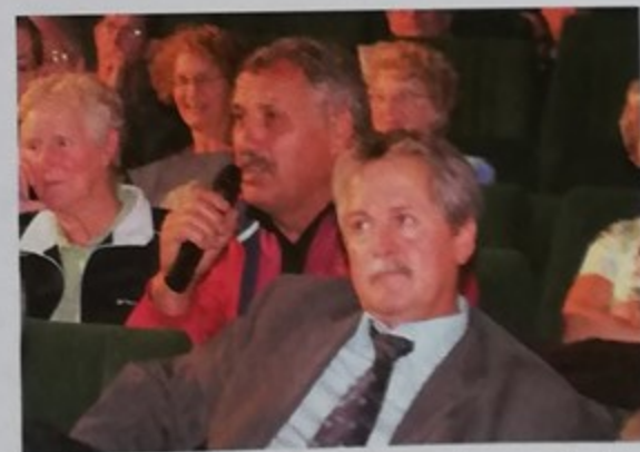
Parmi les participants, des anciens salariés de Chausson sont intervenus