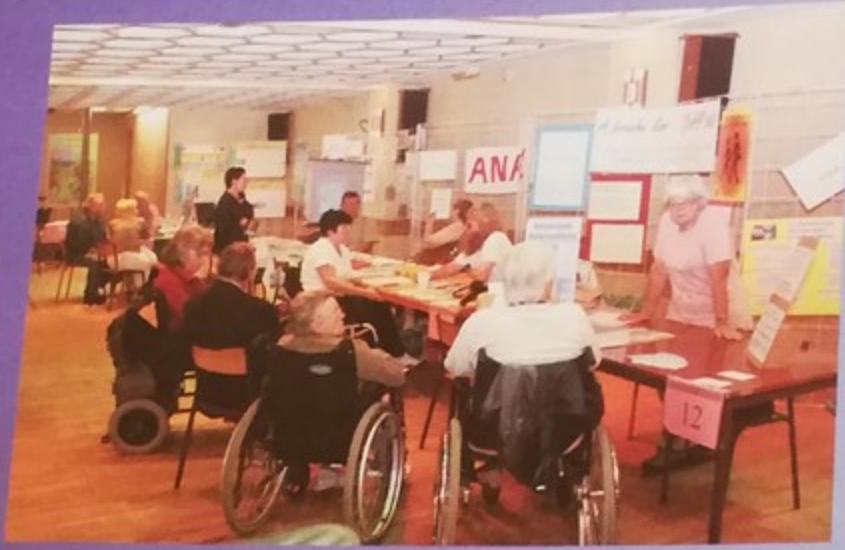
Forum santé handicap salle de la Libération avec la participation de nombreuses associations