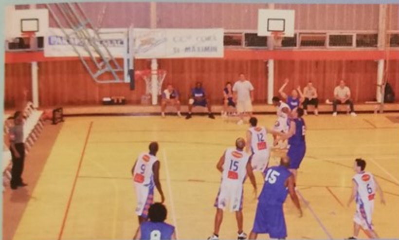
Match de gala entre Saint Quentin Basket-ball (pro b) et JSF Nanterre (pro b) salle Marcel Coene