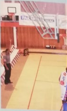
Match de gala entre S Nanterre (pro b) salle M