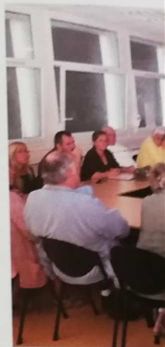
Groupe de travail future cité

La ville associe la population à ses projets d'urbanisme à travers des groupes de travail associant élus, techniciens et habitants. Ainsi, tous, ces rencontres sont une occasion pour les habitants d'exprimer leur avis et d'échanger avec les élus et les techniciens pour tisser des liens avec leurs voisins. Nous vous remercions pour ces trois tenues de