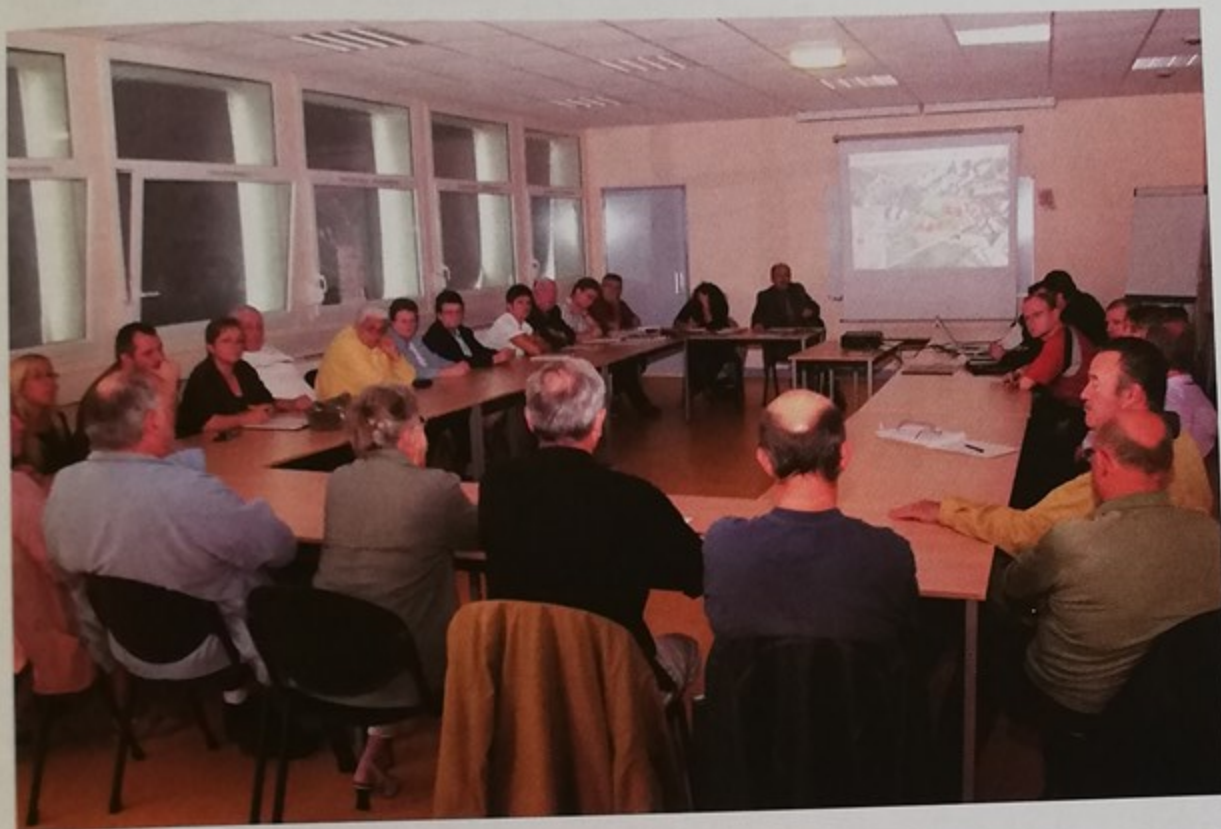
Groupe de travail future cité Jules Uhry

La ville associe la population à ses projets d'urbanisme avec des groupes de travail, réunissant élus, techniciens municipaux et habitants. Ouvertes à tous, ces rencontres sont l'occasion pour les citoyens d'exprimer leurs attentes, d'échanger avec les élus, de tisser des liens avec leurs voisins. Nous vous en présentons trois, tenues en septembre.