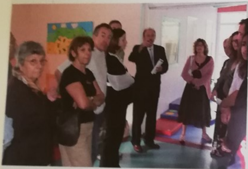
Réception des nouveaux habitants

Le maire accompagne les nouveaux habitants qui ont visité la ville et notamment les nouvelles installations du multi-accueil