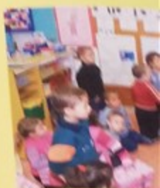
Le Père Noël en tournée dans les écoles maternelles