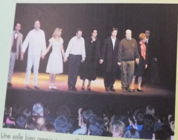
Une salle bien garnie a accueilli la compagnie «théâtre amateur» pour la représentation de William Pig de Christine Blondel