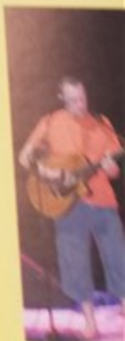
Le groupe «Ma version» dans leurs débuts