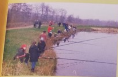
Les enfants des écoles se sont initiés à la pêche à ligne au bord de l'étang avec l'aide des membres de l'association des «Martins-pêcheurs»

Samedi 11 décembre, le parc urbain du Prieuré a été inauguré par la municipalité, la société Granulats de Picardie et les membres de l'Association des Martins Pêcheurs qui le gère en collaboration avec le