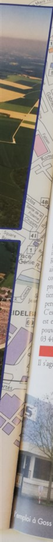
l'emploi à Goss International

Signalons par ailleurs que les salaires de l'ensemble des salariés du privé n'ont augmenté que de 2,4 % selon l'INSEE.