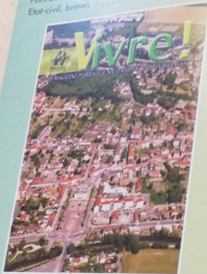
Vue aérienne du centre ville de Montataire