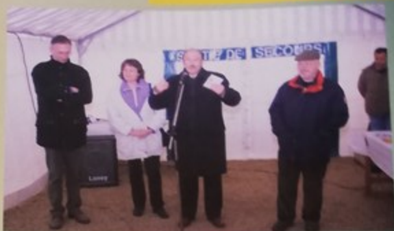
M. le Maire de Montataire avec à ses côtés les représentants de Thiverny, de Granulats de Picardie et des «Martins-pêcheurs» s'est félicité d'une coopération qui a favorisé l'environnement