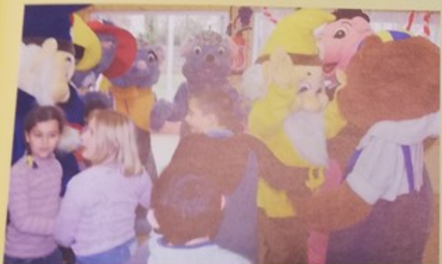
A l'initiative de la municipalité, des peluches vivantes ont rendu visite aux enfants du centre aéré, avant d'animer les rues et les commerces de Montataire