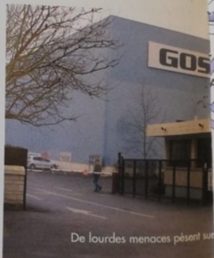
De lourdes menaces pèsent sur

Quant aux mesures concernant les licenciements économiques, elles vont toutes dans leur facilitation plutôt que dans celui de l'aide au salarié