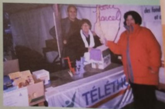
Les adhérents de l'association en pleine action lors du Téléthon

Un dynamisme qui fait de ce quartier l'un des plus actifs de la ville.