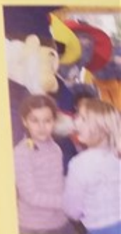
A l'initiative de la Municipalité, une visite aux artisans et commerçants de la ville