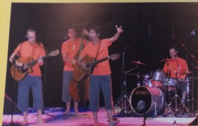
Le groupe «Bacs à sable» a emmené les petits spectateurs du Palace dans leurs aventures extraordinaires