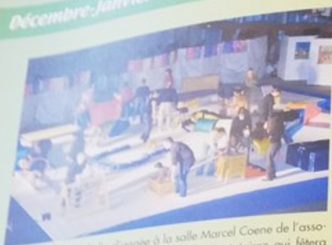
Traditionnelle fête de fin d'année à la salle Marcel Coene de l'association de gym «Espérance Municipale de Montataire» qui fêtera son centenaire en 2025