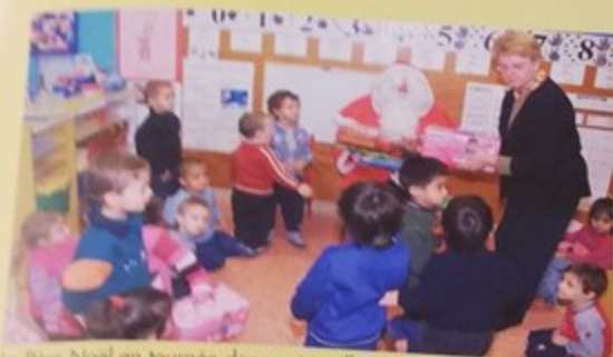
Le Père Noël en tournée dans notre ville a rencontré les enfants des écoles maternelles