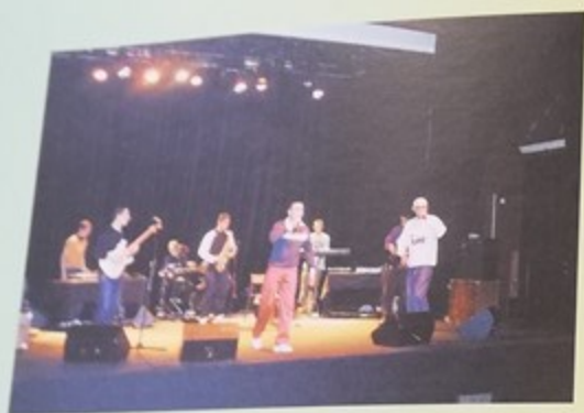
Scène ouverte aux jeunes talents, le groupe «Ma version» était sur les planches du Palace le 19 décembre