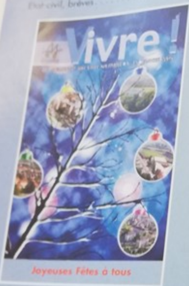
Joyeuses Fêtes à tous