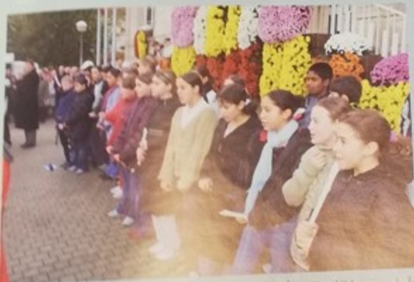
Les enfants du collège Anatole France ont chanté «L'Hymne à la joie» pour la cérémonie du 11 novembre