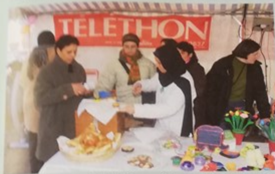
Le rendez-vous annuel du Téléthon a fait appel à la générosité des Alcotakairiens