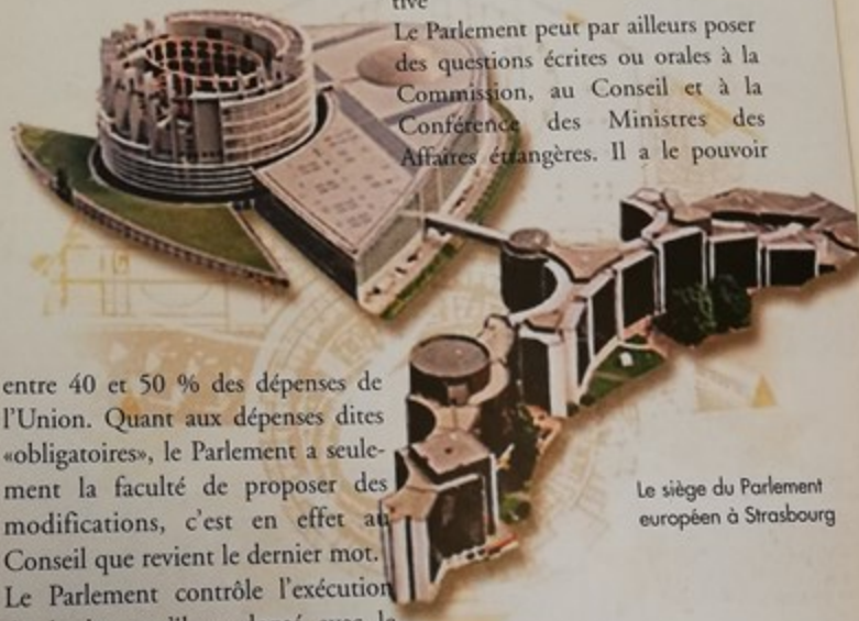
Le siège du Parlement européen à Strasbourg

Le Parlement peut par ailleurs poser des questions écrites ou orales à la Commission, au Conseil et à la Conférence des Ministres des Affaires étrangères. Il a le pouvoir