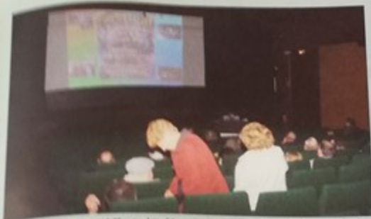
Video Trivelling a diffusé des films réalisés par les adhérents de l'association au Palaco le week-end des 27 et 28 novembre