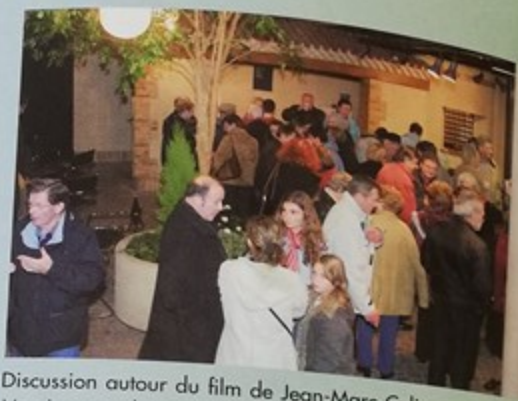
Discussion autour du film de Jean-Marc Culières et Alexandre Messina avec les personnes qui ont témoigné et aidé à la réalisation de «Mémoire ouvrière»

Toujours une grosse affluence à la salle Marcel Coene pour le loto organisé par les échanges «franco-allemands»