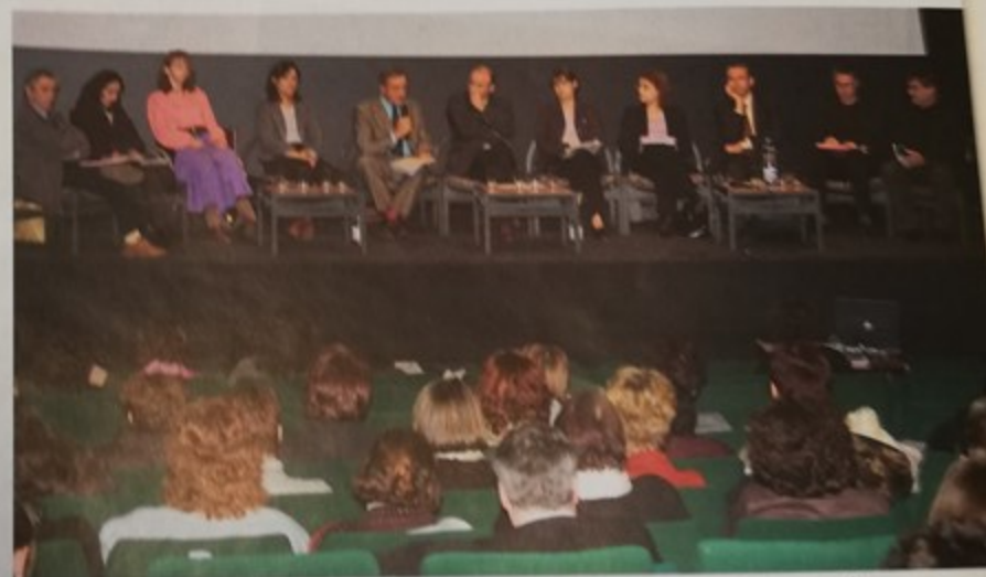
Plus d'une centaine de personnes a participé au forum le 2 décembre au Palace

non pas de leur accroissement mais bien que l'opinion publique semble aujourd'hui davantage prête à ouvrir les yeux sur ces violences dont n'importe quel citoyen peut-être l'auteur. Car il a bien été rappelé par l'ensemble des intervenants que victimes et responsables de violences sexuelles sont présents dans toutes les couches de la société. On peut seulement préciser que 98 % des agressions sexuelles sont commises par des hommes. Si la collaboration et la coordination entre les services est absolument nécessaire en termes de prévention et de signalement, elle l'est autant lorsque la procédure judiciaire est