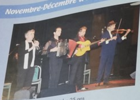
Le Palace archi comble a fêté les 25 ans de scène du groupe Bratsch