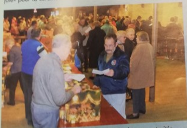
Traditionnelle remise des colis de la Municipalité aux retraités