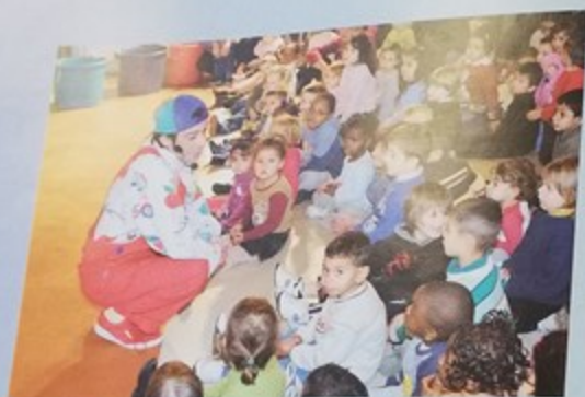
Le mercredi 17 novembre à l'école Henri Wallon a été l'occasion de fêter les droits de l'enfant