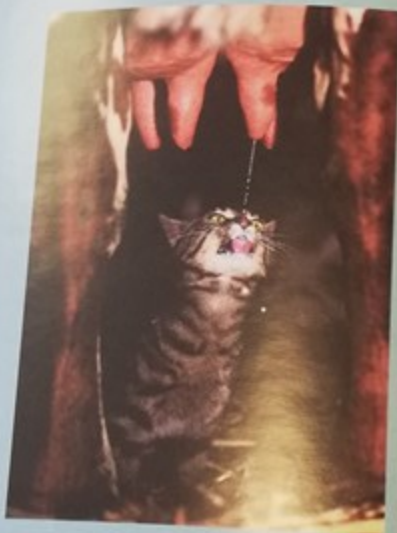
«3 photos sinon rien» le chat de l'étable