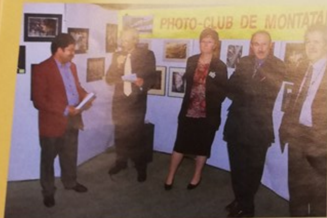
Vernissage et remise des prix du 14 ème concours photo organisé par le Photo club de Montataire