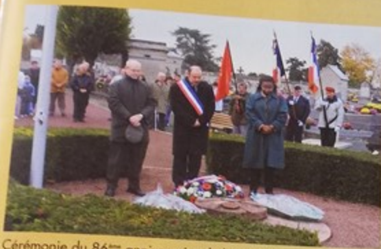
Cérémonie du 86 ème anniversaire de l'Armistice du 11 novembre 1918