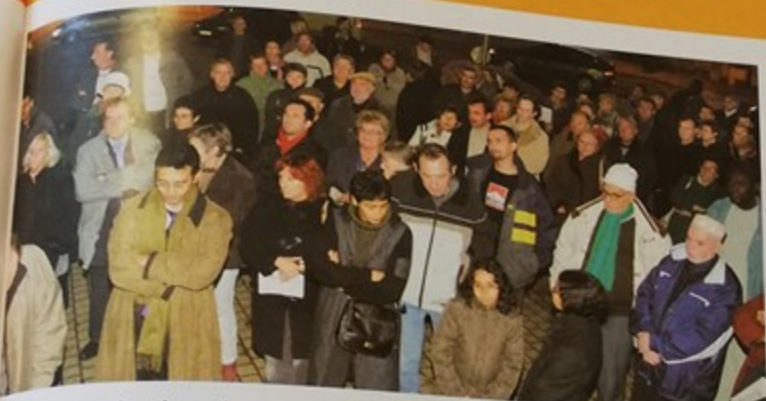
Le 17 novembre de nombreux citoyens ont assisté à l'hommage émouvant rendu à Yasser Arafat, place de la mairie

Au nom du jumelage qui unit la ville de Montataire au camp de réfugiés de Deheisheh en Palestine, Monsieur le Maire a adressé cette lettre ci-dessous au Président de la République française pour dénoncer l'opération de l'armée israélienne qui s'est déroulée dans la bande de Gaza à partir du 29 septembre. L'opération baptisée «Jours de Pénitence» constitue l'incursion la plus importante en Palestine depuis le début de la deuxième Intifada en septembre 2000.