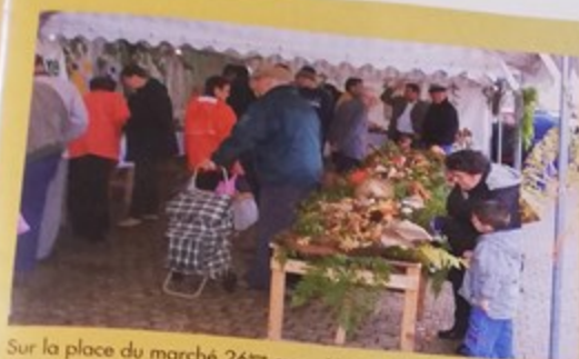
Sur la place du marché 26 ème exposition de l'association mycologique de Montataire