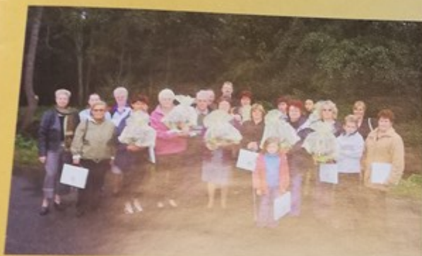
Photo des lauréats du concours municipal de fleurissement 2004