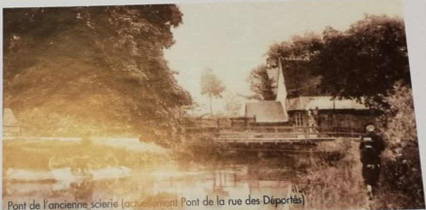
Pont de l'ancienne scierie (actuellement Pont de la rue des Déportés)