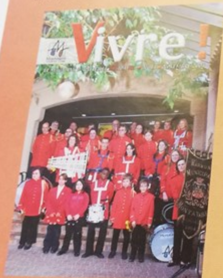
Le centenaire de l'Harmonie Municipale a été fêté au Palace à Montataire