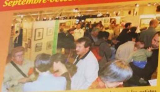
Vernissage du «23ème Festival des Talents Cachés» où les artistes amateurs ont présenté leurs œuvres pour le plus grand plaisir d'un public ravi