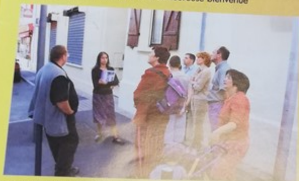
Promenade-découverte des monuments et des bâtiments de la ville dans le cadre des journées du patrimoine avec l'association Mons ad Thérain