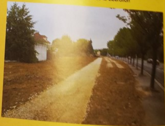
En entrée de ville, une nouvelle perspective s'offre avec un aménagement piétonnier tout le long de la rue de la Libération