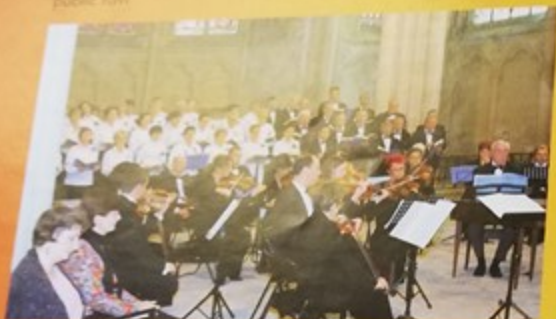
Concert à l'église Notre-Dame par Col'egno, orchestre de Chambre de Compiègne