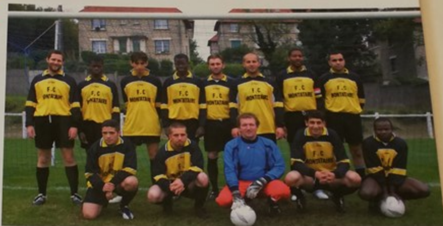
L'équipe Sénior au stade Kléber Sellier

Rétrogradés en cinquième division, ils ont du pain sur la planche. Mais leur entraîneur semble très motivé et confiant, prêt à remonter cette équipe au meilleur niveau. Il est cependant conscient qu'il faut rester extrêmement vigilant notamment lors des matchs où la pression des