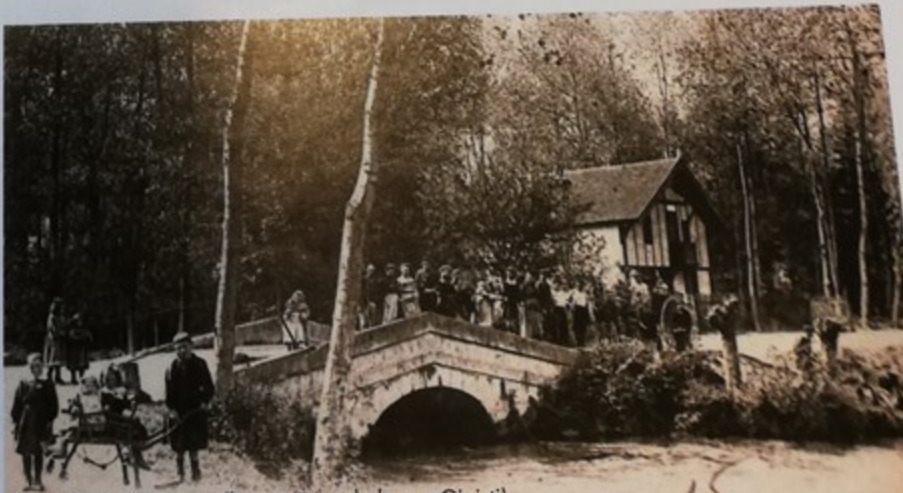
Pont de la ville (actuellement Pont de la rue Ginisti)