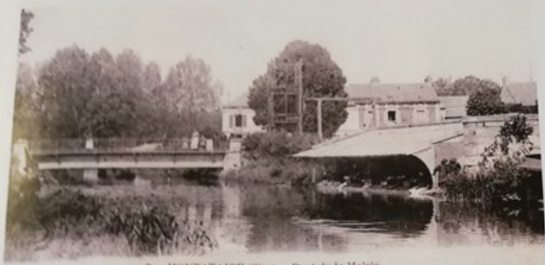
Montataire 9 — MONTATAIRE (Oise) — Pont de la Mairie — Touristes à Montataire

Pont de la Mairie (actuellement Pont Ambroise Croizat)