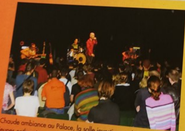
Chaque ambiance au Palace, la salle investie par de très nombreux jeunes enthousiasmés a fait un triomphe au groupe «Fatals Picard»