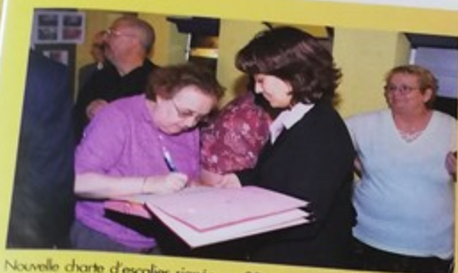
Nouvelle charte d'escalier signée au 28, rue Roger Salengro entre les locataires et Oise-Habitat. La charte témoigne d'un engagement mutuel entre l'organisme et les locataires pour améliorer le cadre de vie et pérenniser les aménagements entrepris à cet effet