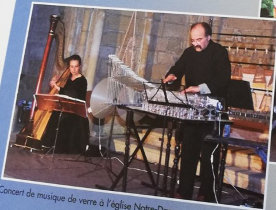
Concert de musique de verre à l'église Notre-Dame