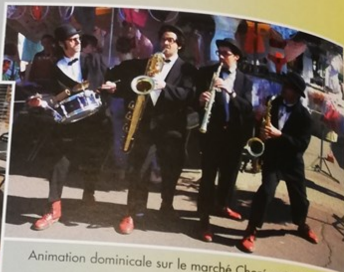
Animation dominicale sur le marché Chorégrafic Band Trio