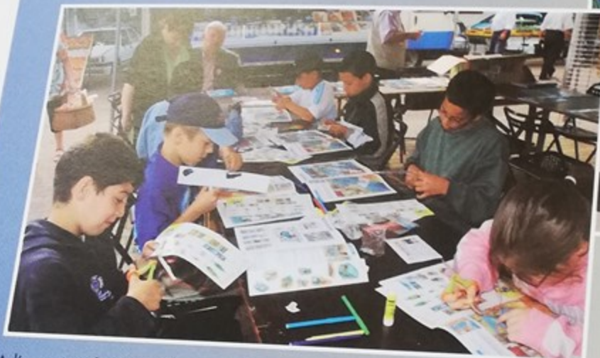
A l'occasion de la journée contre la violence routière les élèves de l'école Jean Jaurès travaillent sur un livret ludique de la sécurité routière place de la mairie