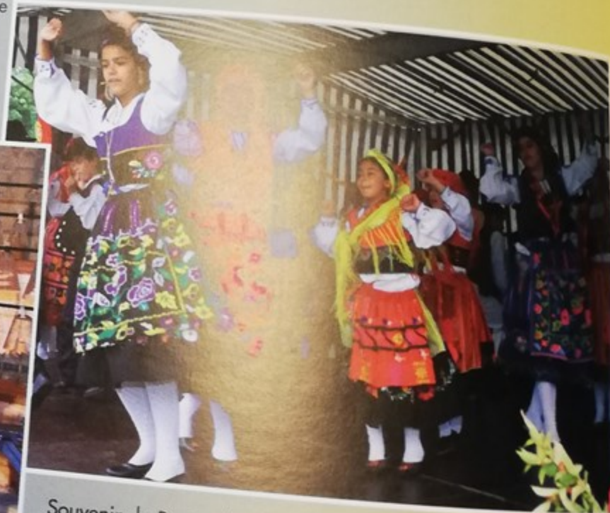
Souvenir du Portugal de Montataire au festival «Dances et Musiques du Monde»