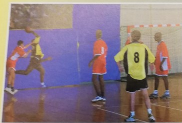
Tournoi de Hand ball inter-régional à la salle Marcel Coene