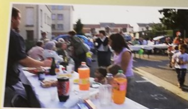
Immeubles en fête sur le parking de la rue Quénardel. 500 Montatairiens ont participé à cette opération dans six quartiers de la ville