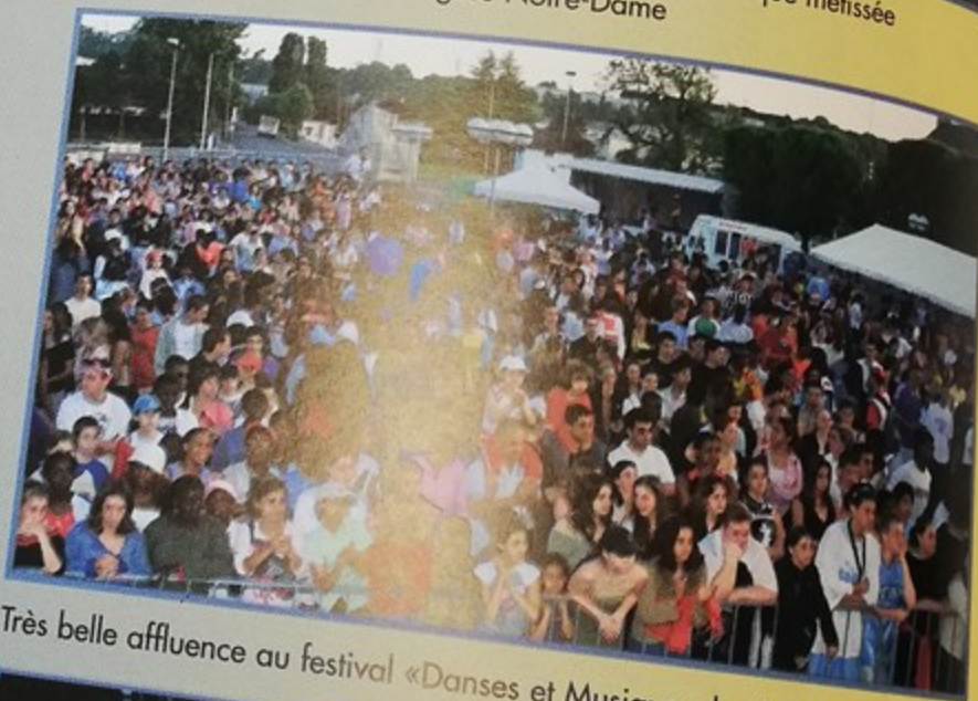
Très belle affluence au festival «Dances et Musiques du Monde»