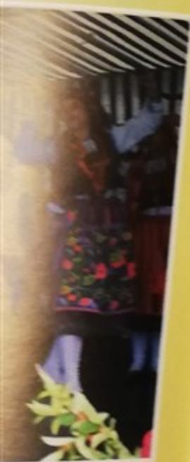
...ses et Musiques