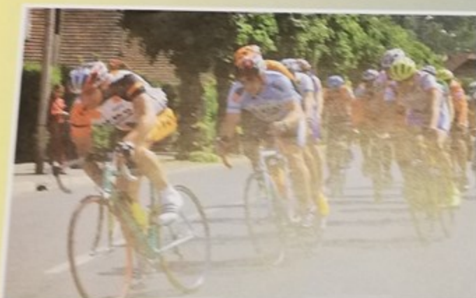
Grand Prix de l'Office Municipal des Sports