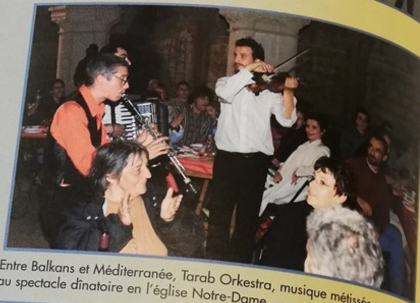
Entre Balkans et Méditerranée, Tarab Orkestra, musique métissée au spectacle dînatoire en l'église Notre-Dame