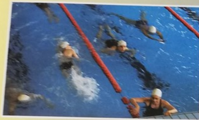
Six heures de natation à la piscine intercommunale de Montataire