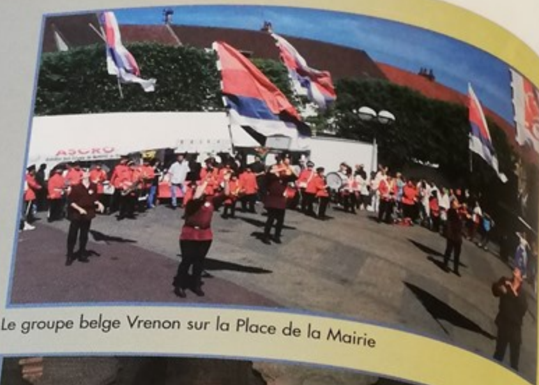
Le groupe belge Vrenon sur la Place de la Mairie