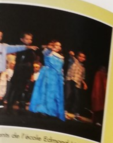
...ants de l'école Edmond Lévêillé