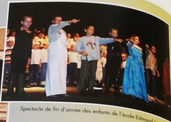
Spectacle de fin d'année des enfants de l'école Edmond Lèveillé