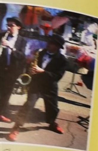
Chorégrafic Band Trio