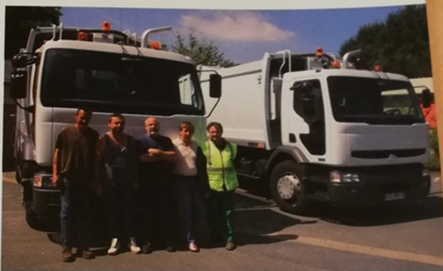
Les deux nouvelles bennes ultra-modernes acquises par la ville et les agents du service