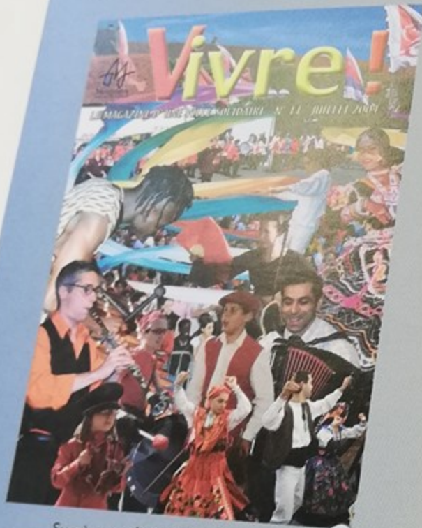
Succès pour le troisième festival «Dances et Musiques du Monde»