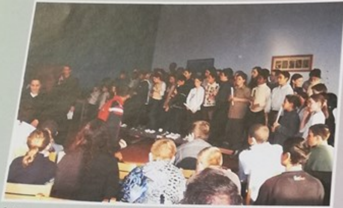
Soirée poésie et musique au Collège Anatole France à l'occasion du printemps des poètes