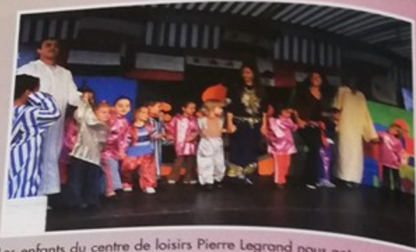
Les enfants du centre de loisirs Pierre Legrand nous ont montré leurs talents d'artistes lors de la soirée interculturelle