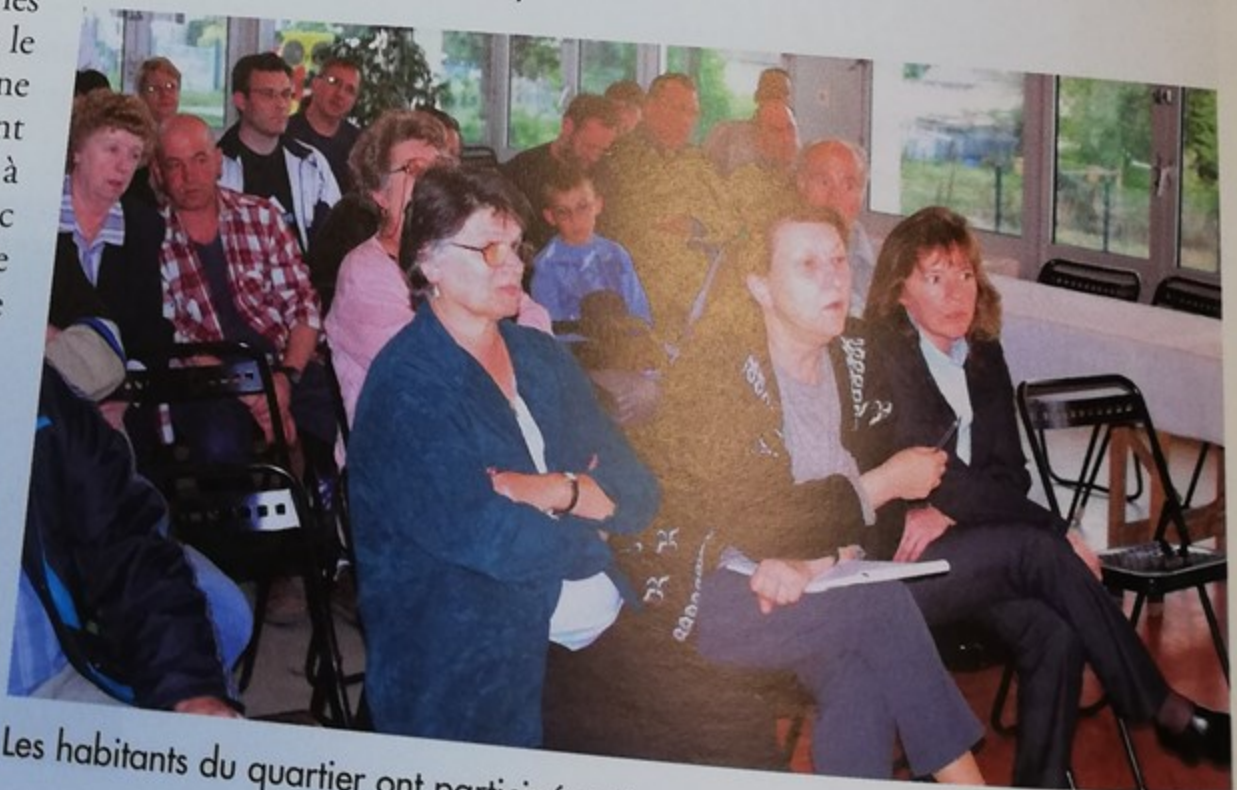
Les habitants du quartier ont participé activement aux différentes rencontres