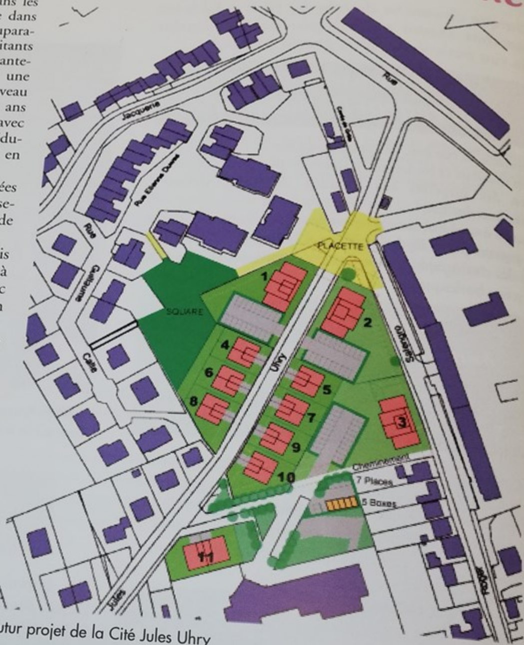
Futur projet de la Cité Jules Uhry

Les habitants de la cité Jules Uhry seront prioritaires dans l'attribution de ces nouveaux logements pour ceux qui voudront revenir une fois la cité reconstruite.