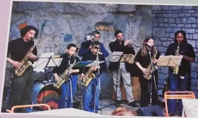
Apéro Jazz au petit château dans une ambiance chaleureuse et conviviale