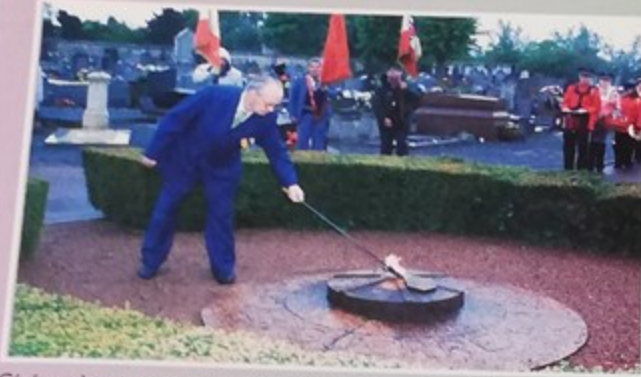
Cérémonie commémorative du 59 ème Anniversaire de la capitulation de l'Allemagne nazie le samedi 8 Mai 2004