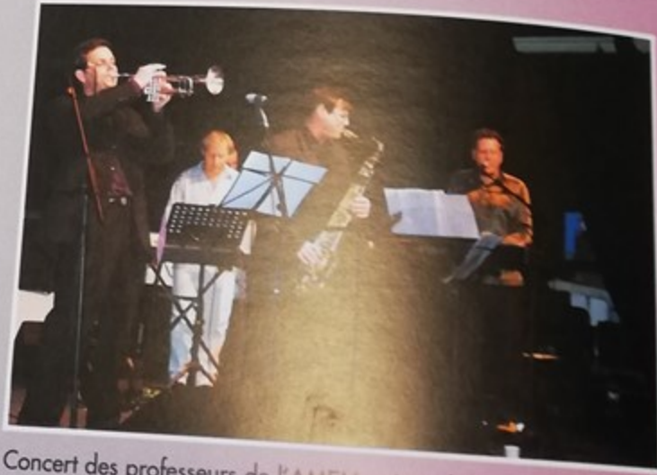
Concert des professeurs de l'AMEM qui ont fait partager un programme de qualité et de diversité musicale