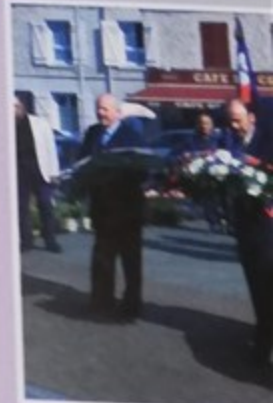
Cérémonie commémorative de la libération des Camps