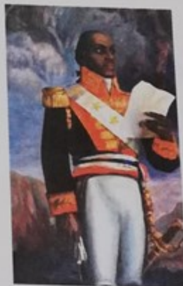
Toussaint Louverture, chef de la révolte qui conduira à l'abolition de l'esclavage

ter à l'exécution des autres condamnés. Je ne pourrai jamais oublier ça. C'est le Consul de France de l'époque qui a fait les démarches pour obtenir ma grâce, au nom de mon père, tombé à Montecassino. Duvalier et son régime m'ayant banni du territoire, la France m'a accordé le statut de réfugié politique. J'ai repris le contact il y a seulement trois ans avec des Haïtiens. Je ne comprends pas comment on a pu oublier la mémoire de Toussaint Louverture et de tous ces noirs qui sont morts les armes à la main. Ils chantaient : « Nous n'avons pas de passé, nous n'avons pas de parents, nous n'avons pas de présent, nous n'aurons pas d'avenir, mais nos enfants auront un passé, un présent, un avenir »