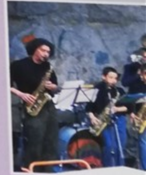
Apéro Jazz au petit château conviviale