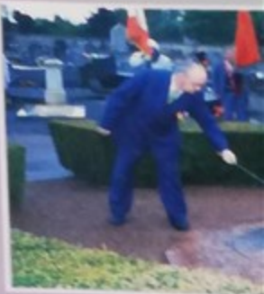
Cérémonie commémorative du 55 e l'Allemagne nazie le samedi 8 Mai