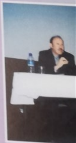
Des points de vue pour combattre les discriminations par l'Association de parents de plus de 70 personnes