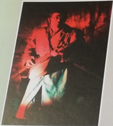
Eblouissante performance de l'acteur Alain Stach dans la pièce : «Mémoire d'un rat» de Pierre Chaine