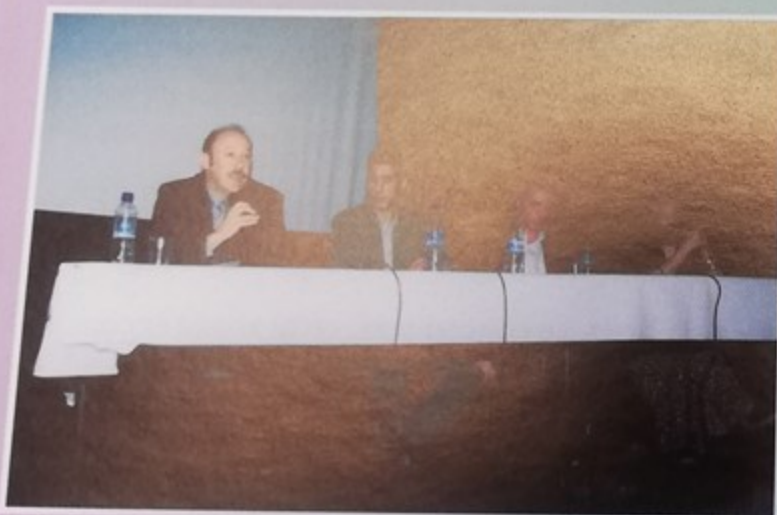
Des points de vue différents, mais une volonté commune de combattre les discriminations lors du débat organisé au Palace par l'Association des Maghrébins de Montataire qui a rassemblé plus de 70 personnes