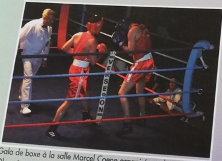
Gala de boxe à la salle Marcel Coene organisé par le Ring Olympique André Clerc de Montataire