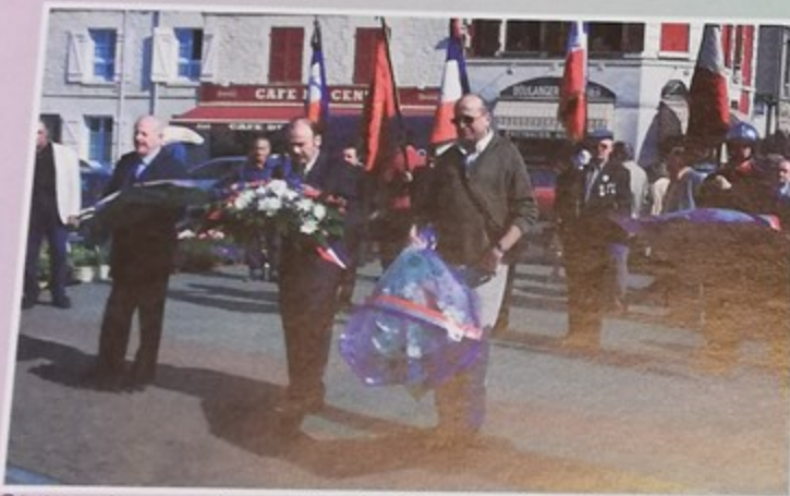
Cérémonie commémorative du 59 ème Anniversaire de la libération des Camps