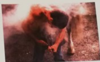
Maréchal ferrant