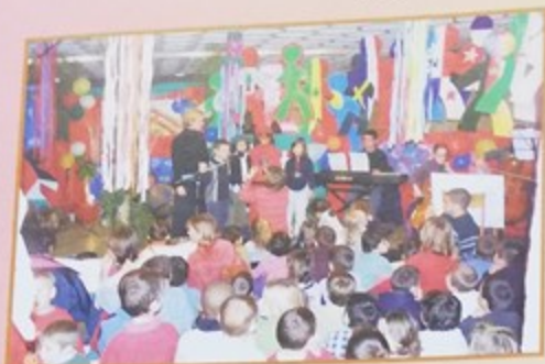
Journée internationale des droits de l'enfant à la salle de la Libération

Réception de bienvenue : les nouveaux habitants de Montataire ont pu dialoguer en toute convivialité avec M. le Maire et les élus de notre ville