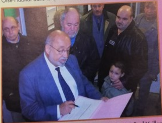
Deux nouvelles chartes ont été signées au 1 et 3, rue Paul Vaillant Couturier entre les locataires et Oise-Habitat. La charte témoigne d'un engagement mutuel entre l'organisme et les locataires pour améliorer le cadre de vie et pérenniser les aménagements entrepris à cet effet