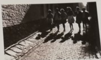
Ecoles