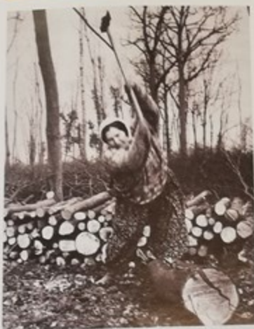
Bucheronnage