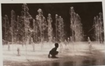
Jeu d'eau

Sur les 375 photos envoyées, six ont été primées et une centaine exposée.