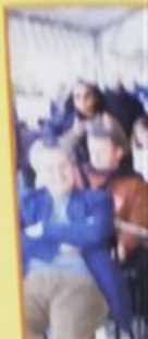
14 décembre, pour Arcelor