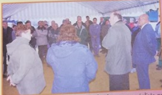
Réception avec les habitants pour la fin des travaux réalisés par Oise-Habitat dans le quartier des Champarts