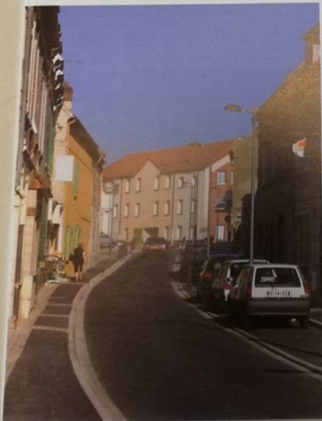
Après les rues Jean Jaurès et Lénine la dernière tranche des travaux concernera la rue de la République en 2004

Les places de stationnement ont été aménagées et la chaussée redessinée afin de redistribuer l'espace entre véhicules et piétons. Chacun y a maintenant sa place. Les ralentisseurs qui ont été installés y sont aussi pour quelque chose.