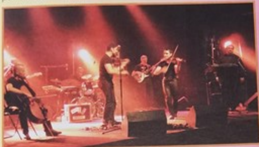
Chaque ambiance au Palace : les 300 spectateurs ont vibré sur la musique tzigane et yiddish du groupe «Les Yeux Noirs»