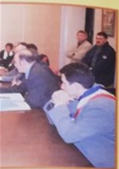
aire et notre conseiller le Montatairiens dent du département geant que la ville puisse tales pour ses opérations