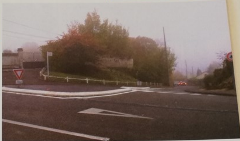
En haut de la rue du Jeu d'Arc, un aménagement au carrefour avec la rue Anatole France a été réalisé

Ces travaux qui représentent un coût global de 3,8 millions d'euros ont été divisés en trois tranches. Il faut compter huit mois de travaux