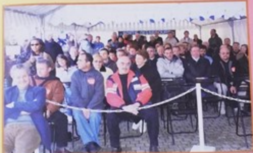
14 décembre, place de la Mairie, conseil municipal extraordinaire pour Arcelor : la population est venue nombreuse à la séance