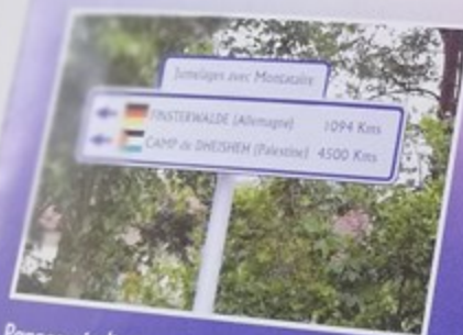
Panneau indicateur inauguré lors du 40ème anniversaire du jumelage Montataire-Finsterwalde