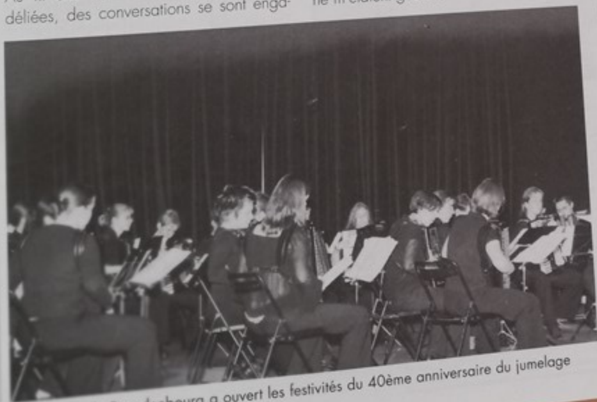
L'orchestre de Brandebourg a ouvert les festivits du 40me anniversaire du jumelage

A plusieurs reprises, j'ai eu envie d'abandonner mon rle d'interprte pour me joindre  la discussion. On n'imagine pas combien cela peut tre enrichissant d'changer avec des personnes de tous ges confondus.