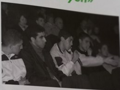
Des jeunes qui participent et prennent la parole

Pour la troisième édition du Festival de la citoyenneté l'Association J.A.D.E a organisé le vendredi 15 mars 2002 un débat-conférence au cinéma Pathé de Montataire sur le thème du vote.