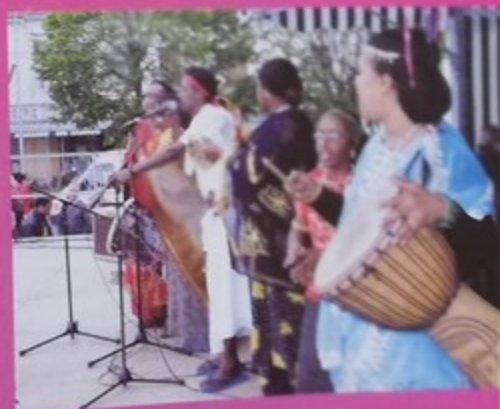
Chants et danses de Djibouti