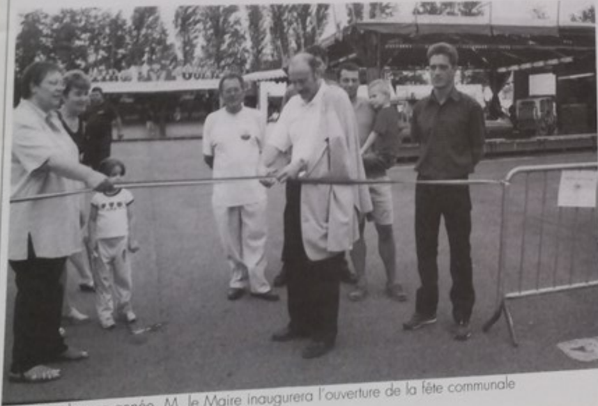
Comme chaque année, M. le Maire inaugure l'ouverture de la fête communale

Une plaquette d'information vous donne en détail le programme de toutes les activités d'été.