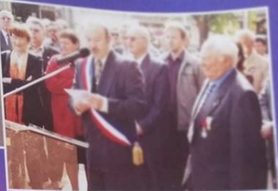
Cérémonies commémorant le 57 e anniversaire de la capitulation de l'Allemagne nazie