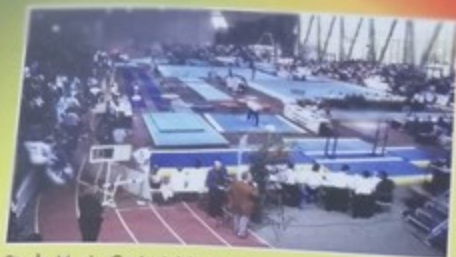
Stade Marie Curie à Nogent