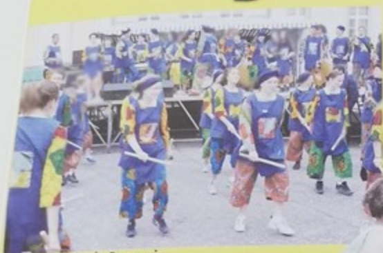
La Bande de Beauvais