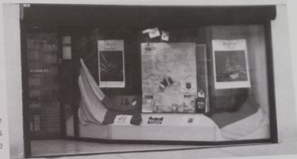
Dcoration d'une vitrine aux couleurs du jumelage