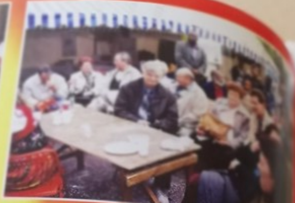
La délégation de Finsterwalde au festival de Montataire