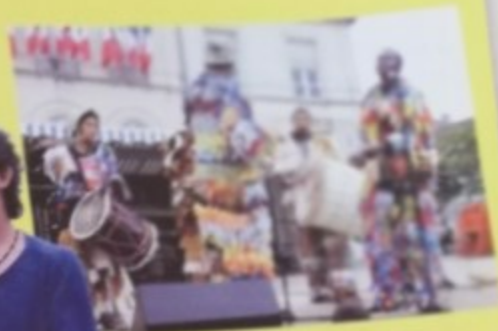
Percussions des Antilles