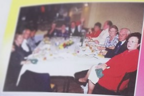
Agape de l'Agape