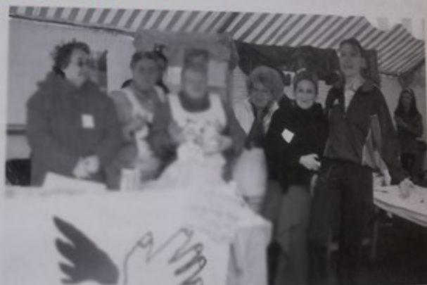
Sympathique ambiance avec les militantes du S.P.F.

Avec les enfants, les jeunes, les femmes et les hommes de tous les âges, on peut faire de la solidarité tout en se faisant plaisir. Les idées ne manquent pas et vous en avez ! Nous vous invitons à nous rejoindre