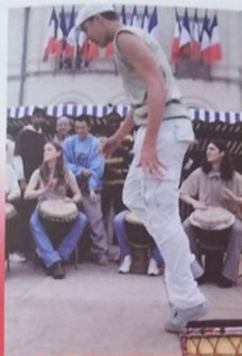
Atelier de percussions de l'AMEM