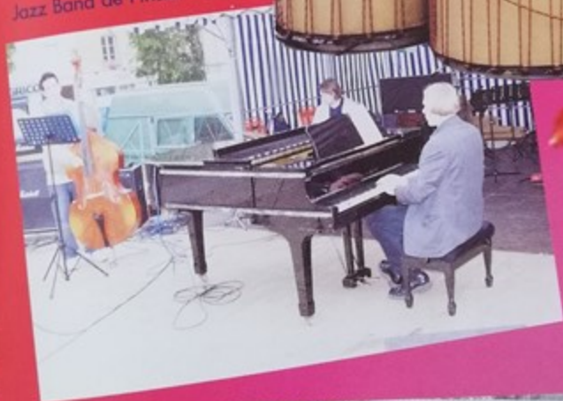
Jazz Band de Finsterwalde