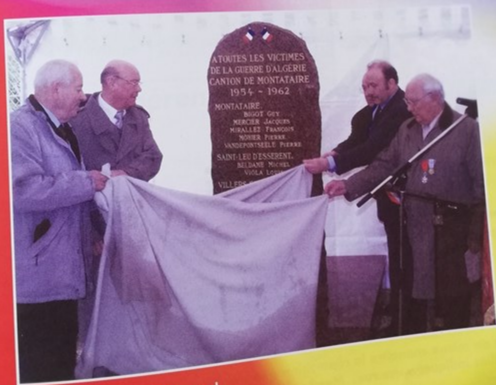
Inauguration de la stèle à la mémoire de toutes les victimes de la guerre d'Algérie