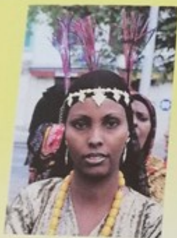
Défilé des élus