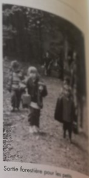
Sortie forestière pour les petits.

Participation financière : 1,5 Euro la quinzaine.