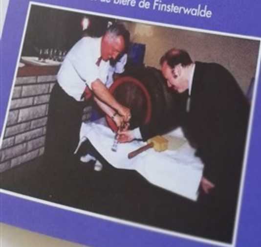
Ouverture du fût de bière de Finsterwalde