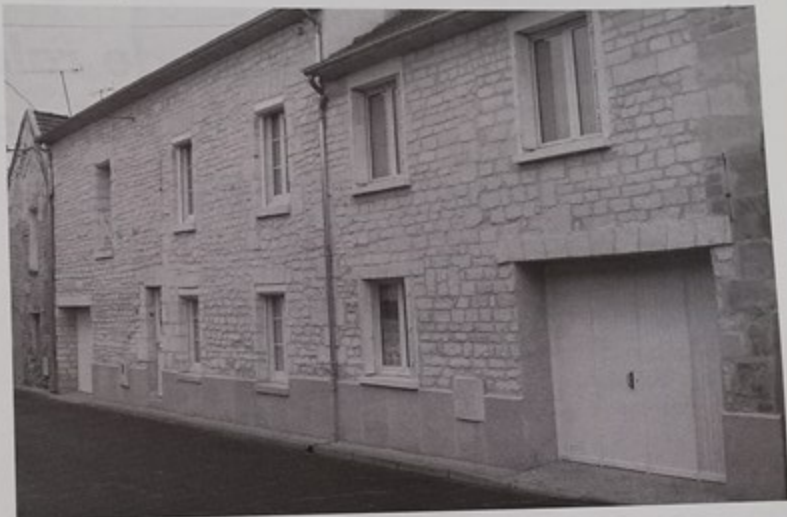
Des façades renovées grâce à l'OPAH