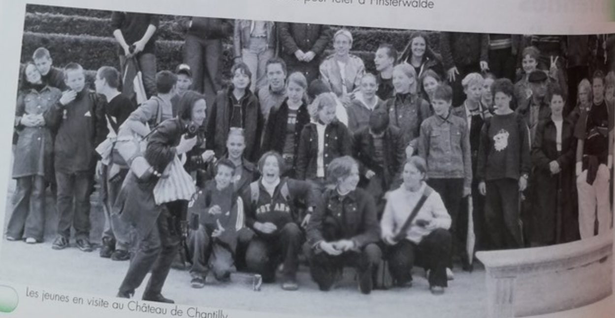
Les jeunes en visite au Château de Chantilly

Adresser la correspondance à : M. Michel Ringenbach Mairie de Montataire BP 50209 - 60762 Montataire cedex