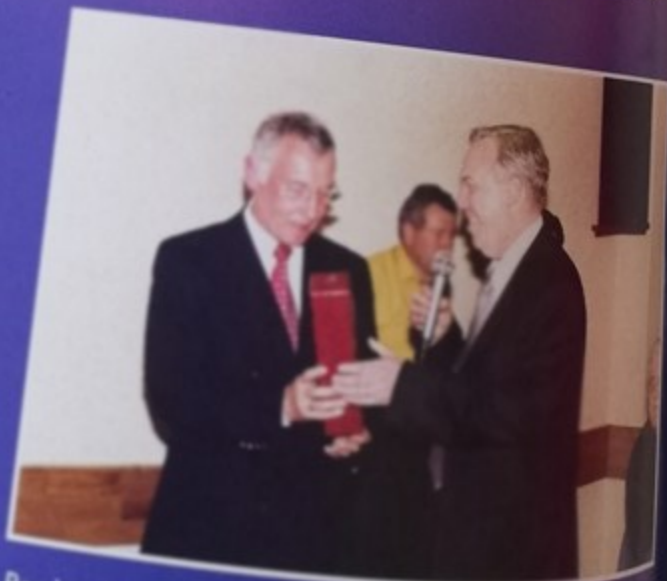
Remise des cadeaux

• Accueil • Ecoles • Action sociale • Services publics • Vie associative • Etat civil 1ère Festival Danse 3ème Concours Vivre ! N° 26 - Juin Directeur de la p Directeur de la C Composition-Mag Photos : Impression - com Imprime Vivre ! mag de Rue André G http ://ww Téléphone Télécopie