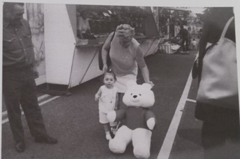
«Nounours fait aussi partie de la fête»

Clôture de la fête le 26 août avec le tirage de la tombola vers 21 H (billets à retirer chaque jour sur les métiers forains) et demi-tarif sur les manèges.