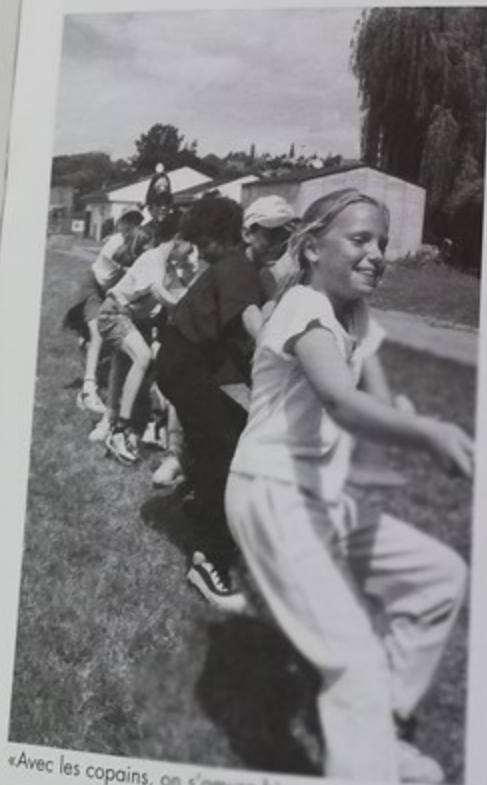
«Avec les copains, on s'amuse bien»