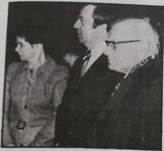
Au centre Maurice Bambier

Année nouvelle, année qui se termine, mais des problèmes qui demeurent, telle est la caractéristique de la situation. Le chômage, la hausse permanente des prix, accroissent les difficultés de celles et ceux qui vivent de leur travail.