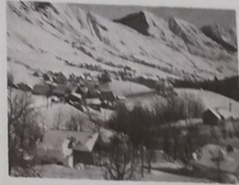
Vue générale de Saint-Sorlin d'Arves

Saint-Sorlin est un petit village typiquement savoyard de 300 habitants qui peut recevoir jusqu'à 5.000 touristes. Il est situé à 23 kms de Saint-Jean de Maurienne sur la route du col de la Croix de Fer. Il est à 1.540 mètres d'altitude et domine la vallée de la Maurienne. Il est entouré de sommets :