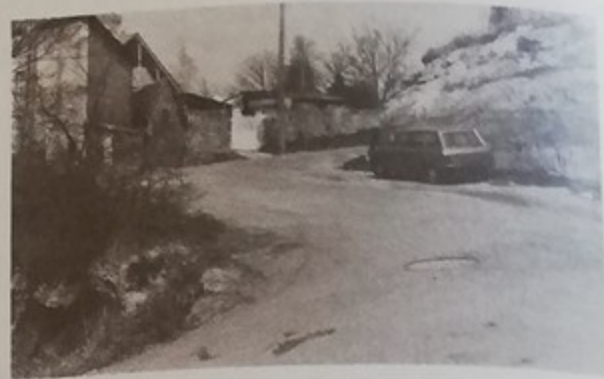
La rue du Jeu d'Arc Sa réfection prévue dans le programme 1976 était vraiment nécessaire

Ceci dit, nous espérons que ce programme sera terminé avant l'hiver. L'exécution de la rue Emile Zola, étant fonction d'un crédit du District (pour l'achèvement du réseau d'eaux usées et pluviales), viendra peut-être en dernier.