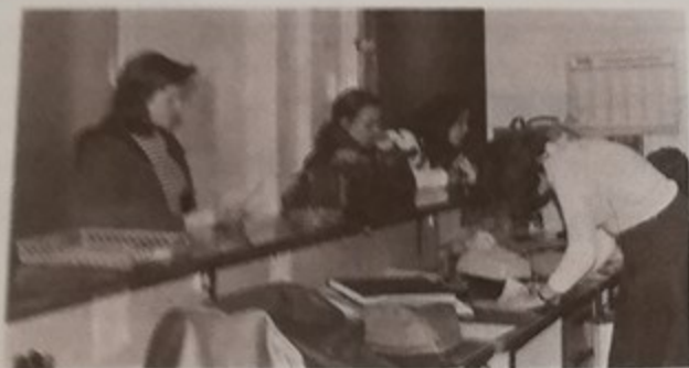
Le bureau d'Etat Civil le jour de pointage des chômeurs

Nous vous rappelons que le pointage a lieu toutes les deux semaines, le mercredi matin de 8 h. 30 à 11 h. 30 à la Mairie (Etat Civil).