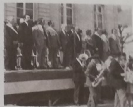
Le Maire, les élus, les personnalités devant la Mairie lors de l'exécution de la Marseillaise