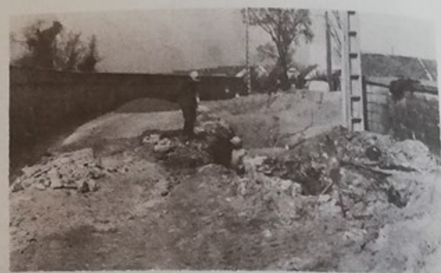
Rue Anatole France Mise en place du réseau d'écoulement des eaux pluviales