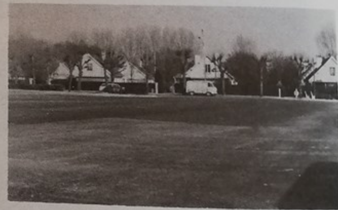
Le nouveau parking Avenue Ambroise Croizat