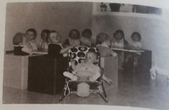
Les jeunes enfants à la Crèche

● somme allouée pour l'action sociale ● au budget primitif 1976 : 2.271.792,50 ● soit 13,17 % du budget.