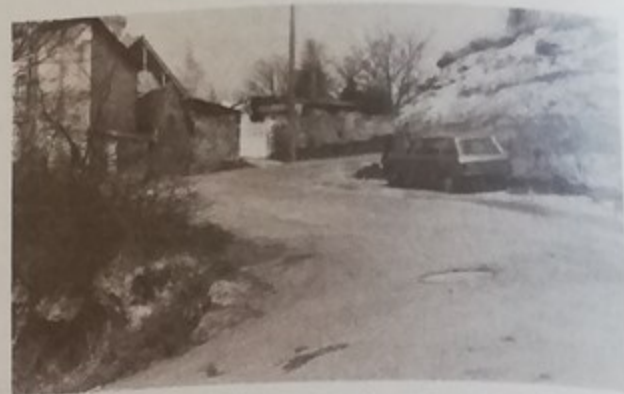
La rue du Jeu d'Arc Sa réfection prévue dans le programme 1976 était vraiment nécessaire

D'autre part compte tenu des textes en vigueur, le montant de ces travaux fait l'objet, à la date de leur exécution, d'une actualisation, c'est-à-dire d'une augmentation en fonction du nouvel indice des prix.