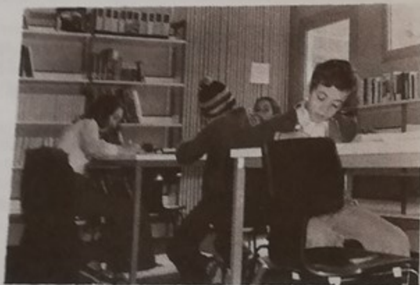
Chacun paraît passionné par la lecture à la Bibliothèque Elsa Triolet

A Montataire, depuis 10 ans, la Municipalité a ouvert deux bibliothèques municipales : Paul Eluard en 1967 et Elsa Triolet en 1974. Plus de 200 millions y ont été consacrés pendant cette période pour la construction, l'aménagement, l'achat de livres, l'animation et le personnel. L'Etat y a participé pour environ 10 %.