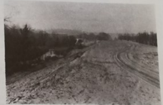
Etat actuel des remblais entre les ponts du C.D. 123 et du Thérain

Quant à nous, nous attendons la réalisation complète pour cette année !