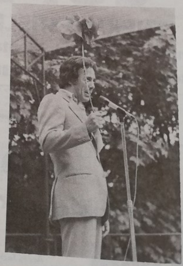
Quelques vues de la fête