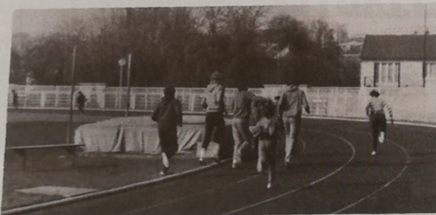
Deux écoles sportives de Montataire Le basket-ball - L'athlétisme